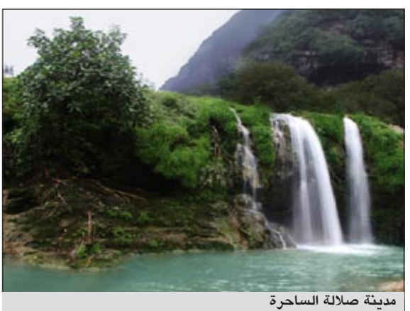
مدينة صلاة الساحرة

صلالة - كونا: أكد رئيس بلدية ظفار رئيس اللجنة المنظمة لمهرجان صلالة السياحي سالم ابن عوفيت الشنقري أن مدينة صلالة استعدت لمهرجان وخريف صلالة 2011 يوم الجمعة القادم واستقبال الموسم السياحي.