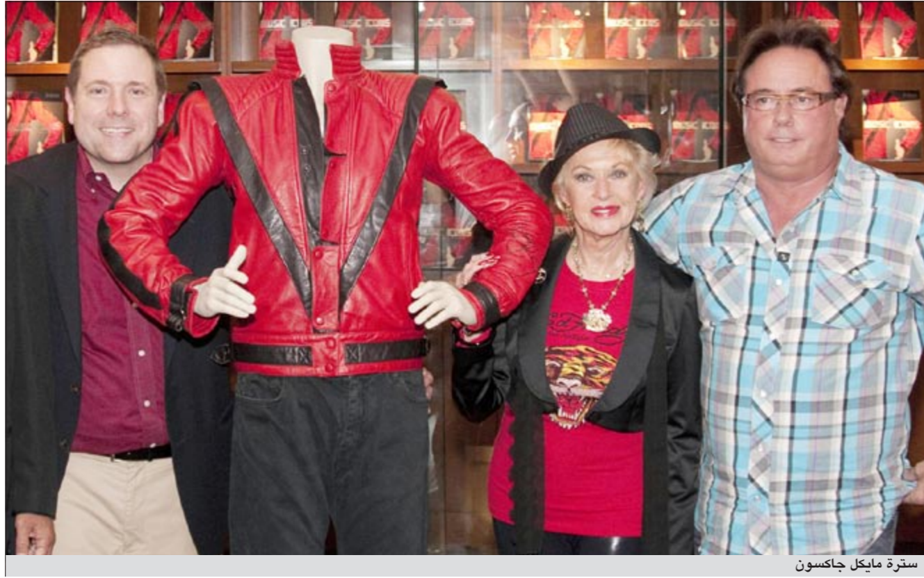
ستره مايكل جاكسون

وفي محاولة لتدارك الموقف، كتب أخو جوناثان قائلا: «لقد حصل أخي علي «إكس بوكس» بالفعل، ومن يريد أن يراه فيلنتظر «الفديديو» المقبل»، لكن لم يحمل هذا الفيديو، «الفديديو» إلى الآن. وذكرت الصحيفة البريطانية أن مصدرا في عائلة «جوناثان» أكد أنه لم يحصل حتى على جهاز الألعاب. زوار «اليوتيوب» يتعاطفون بشدة مع «جوناثان»، ويعرضون على «جوناثان» أجهزة ألعاب «إكس بوكس».