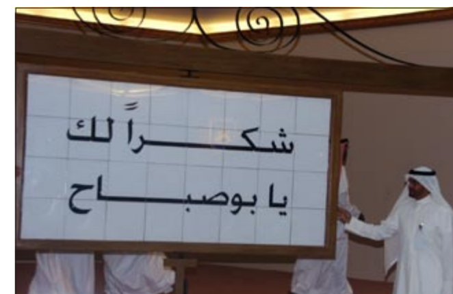
لافتة رفعها أعضاء مجلس إدارة الجمعية لشكر رئيس الوزراء