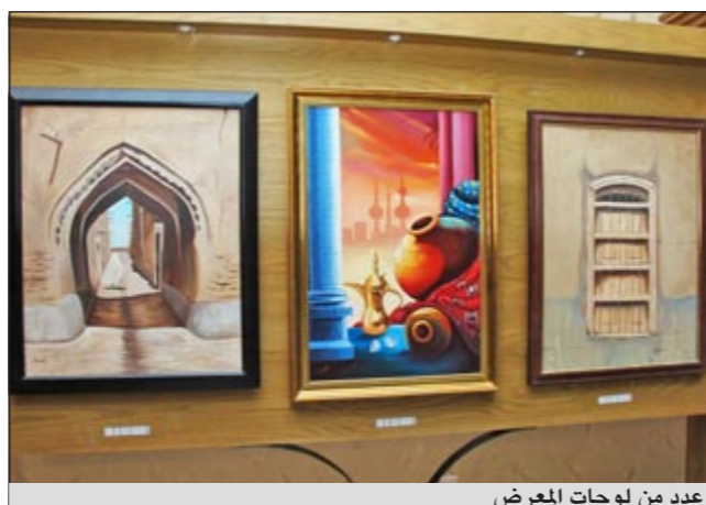
عدد من لوحات المعرض