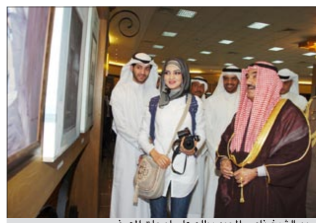
سمو الشيخ ناصر المحمد يطلع على لوحات المعرض

حقيقة وحرص سموه الدائم على دعم الجمعية وأنشطتها، وللواصل مع اخوانه وأبنائه المعلمين والمعلمات والسعي لرفع مكانتهم والارتقاء بشأنهم. وأضاف ان معرض هوايات المعلمين يأتي في اطار الفعاليات والأنشطة الحافلة التي تقدمها الجمعية في مختلف المجالات، ونأتي أهميته من خلال السعي الى إبراز هوايات المعلمين