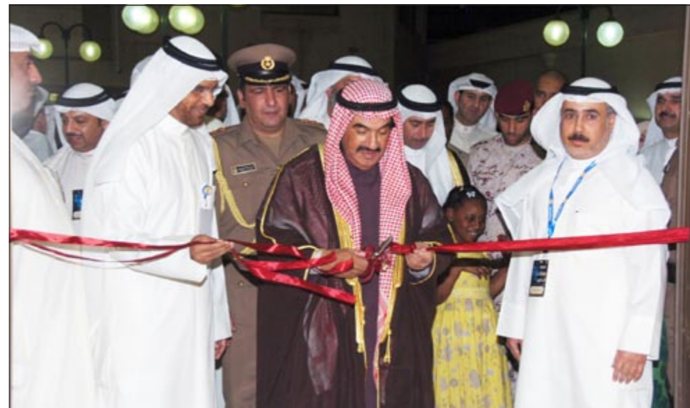
سمو الشيخ ناصر المحمد يفتتح المعرض بمشاركة متعب العتيبي

رئيس الوزراء افتتح معرض هوايات المعلمين التاسع عشر تحت شعار «تراثنا ما يضيح»