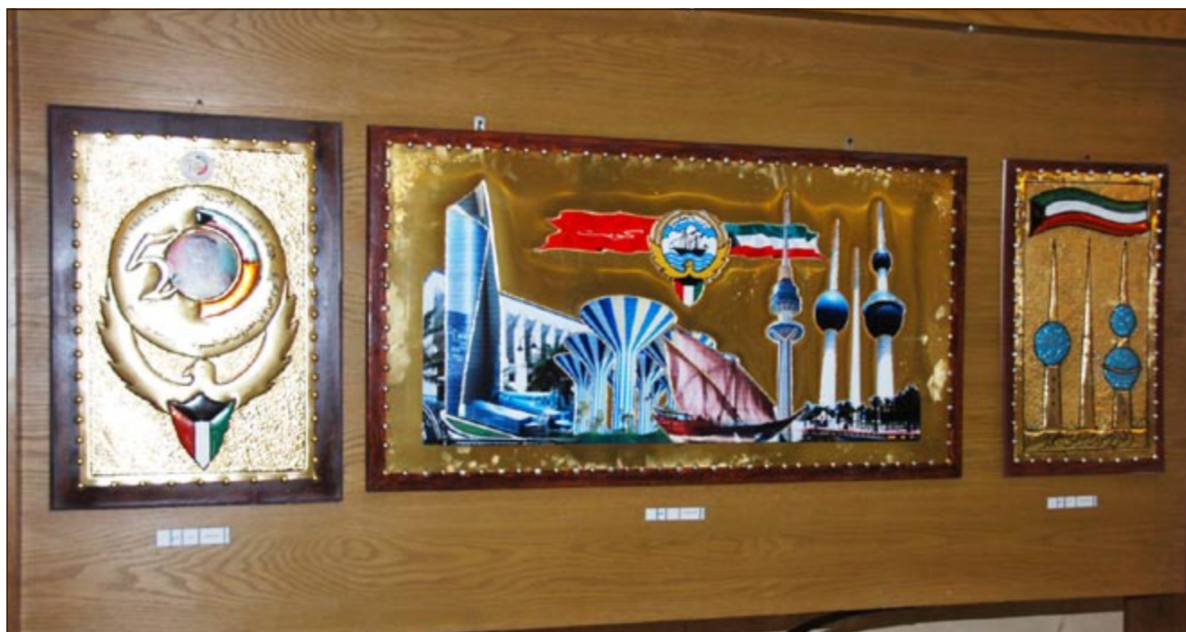
مجموعة من إبداعات المعلمين والمعلمات