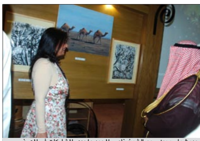
حديث باسم بين سمو الشيخ ناصر المحمد واحدى المشاركات في المعرض

الاستثمار الحقيقي والفاعلة وتأمين المتطلبات والاحتياجات وفق منظور عملي وأقوي ومفترض يتماشى مع التطورات والأمال المنشودة، ومع الرؤى المستقبلية والاستراتيجية لمهنة التعليم ومسيرتنا التربوية وحاجتها الماسة للاستقرار. وأوضح أننا في خضم الأوضاع التي نعيشها وحجم المسؤوليات الجسيمة التي نتحملها جميعاً للأخذ بالتوجيهات الابوية لوالدنا الكبير صاحب السمو الأمير الشيخ صباح الأحمد، فإن جموع المعلمين والمعلمات بجميع شرائحهم وأطيافهم سيقفون دائماً على عهد الوفاء في سبيل تعزيز وحدة الصف وروح الأسرة الواحدة، وفي ترجمة توجيهات سموه الابوية الفياضة الى واقع ملموس، وهي التي جاءت بمثابة مناهج نركز عليها في غرس أنبل المعاني والمثل الخلقية والوطنية في نفوس الأبناء، وفي بناء جيل قادر على مواجهة التحديات،