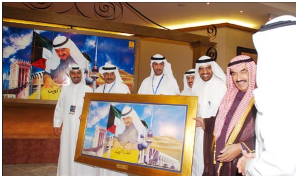
لوحة تحمل صورة تذكارية لسمو الشيخ ناصر المحمد إهداء إلى سموه من جمعية المعلمين (قاسم باشا)