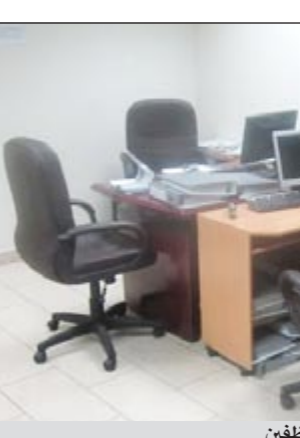
مكتب الهيئة العامة للزراعة خلال من الموظفين