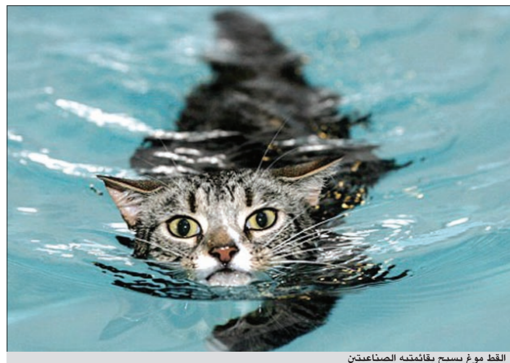
القط موغ يسبح بقائمتيه الصناعيتين

لندن - يو.بي.أي: ساهمت دروس في السباحة في استعادة هر الإحساس بقوائمه ليتمكن من المشي من جديد بعدما دهسته سيارة وأصبح مشلولاً. وأفادت صحيفة «دايلي ميل» البريطانية بأن الهر الرمادي «موغ» لم يعد قادراً على استخدام قائمته الأماميتين بعدما صدمته سيارة لكنه يستعيد تدريجياً القدرة على المشي عليهما من جديد نتيجة إخضاعها لعلاج السباحة الذي يطبق عادة على