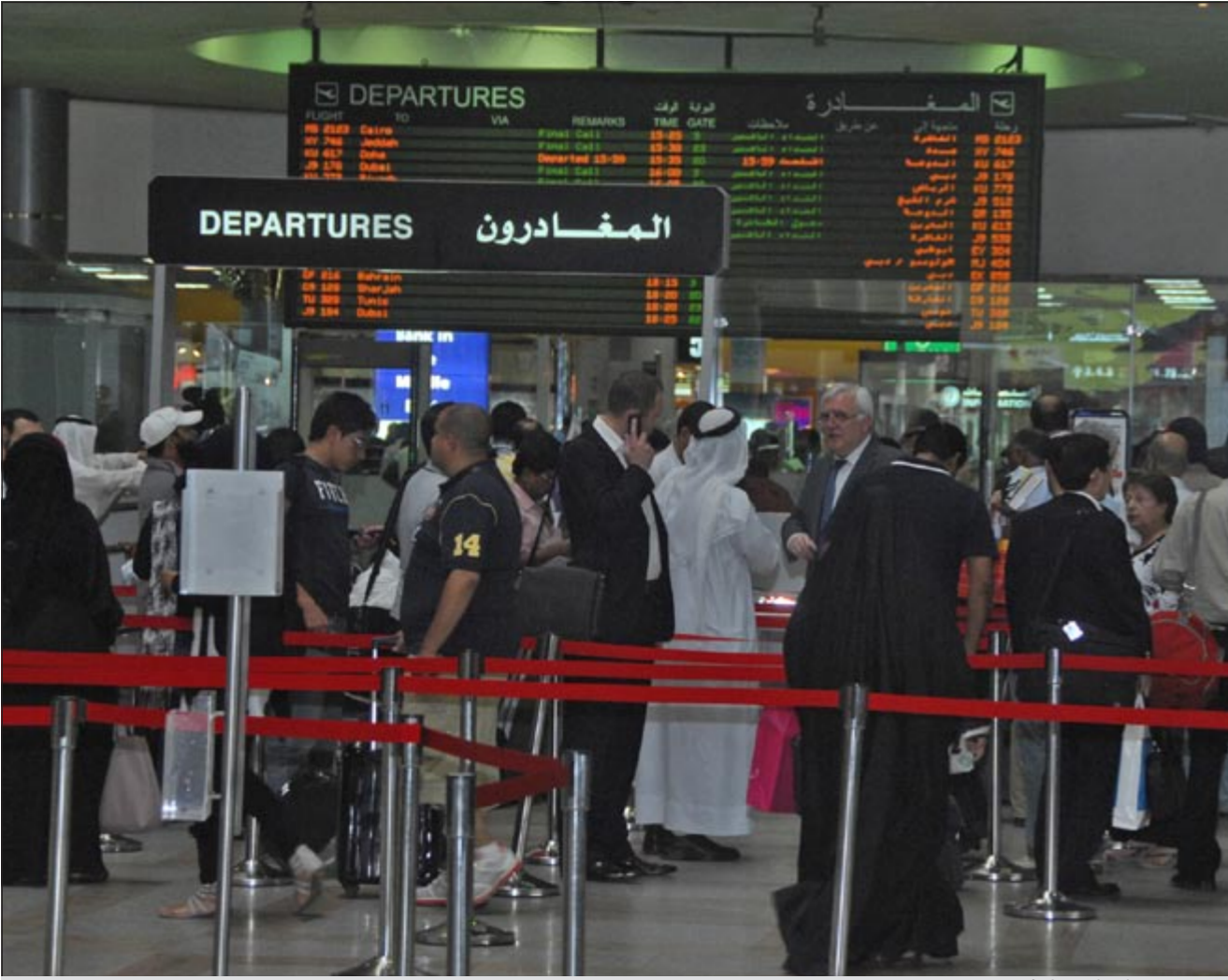
المغادرون وقفوا في صفوف طويلة