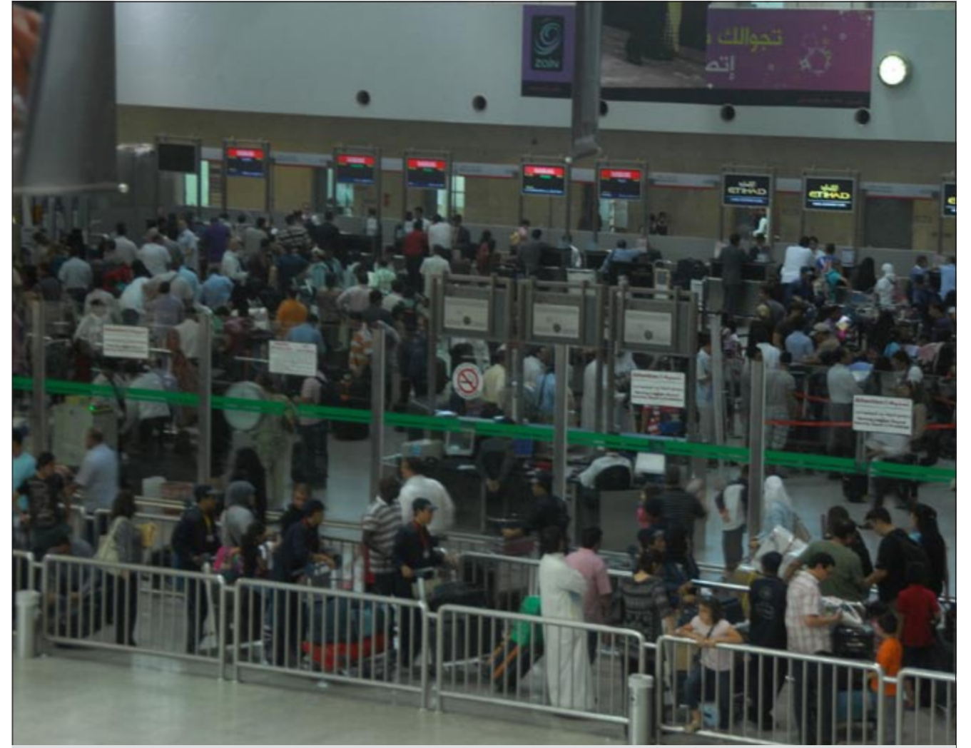
زحام شديد داخل مطار الكويت الدولي يوم أمس الأول

عدد الرحلات المغادرة وصل إلى 105 رحلات يوم أمس الأول