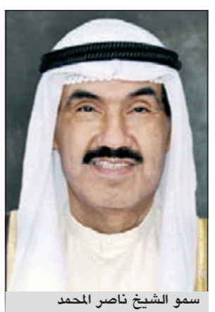
سمو الشيخ ناصر المحمد

الشيخ ناصر المحمد تقريرا حول نتائج الاستجواب الأخير، وكشفت المصادر أن المجلس سيتجه إلى تشكيل لجنة تضم عدداً من الوزراء لدراسة وبحث الملاحظات التي وردت في هذا الاستجواب على أن تكلف أيضاً بمتابعة نتائج معالجة المشكلات والملاحظات التي أثارها النواب في الاستجابات السابقة التي قدمت لرئيس الحكومة. وأكدت المصادر أن هذا التوجه يأتي بناء على تعليمات مباشرة من رئيس الوزراء بهدف تحقيق مزيد من التعاون مع مجلس الأمة خصوصاً أن المحمد أعلن أنه يمد يد التعاون حتى للنواب الذين يساندون طلب عدم التعاون معه. وأشارت المصادر إلى أن هناك