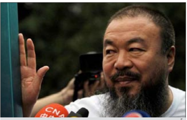
أي وي وي

وقال أصدقاء وانصار للفنان إنه لم يرد على هاتفه ولا يقبل إجراء مقابلات.