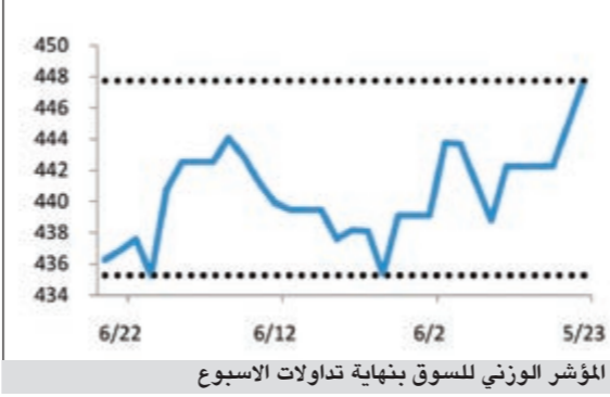
المؤشر الوزني للسوق بنهاية تداولات الأسبوع

وذكر التقرير أن جميع تلك العوامل تعزز من صعوبة خروج السوق من نطاق التذبذب الضعيف والمحدود بل والأفق وهذا ما يهدد لاستمرار السوق بهذا المسار حتى الآن.