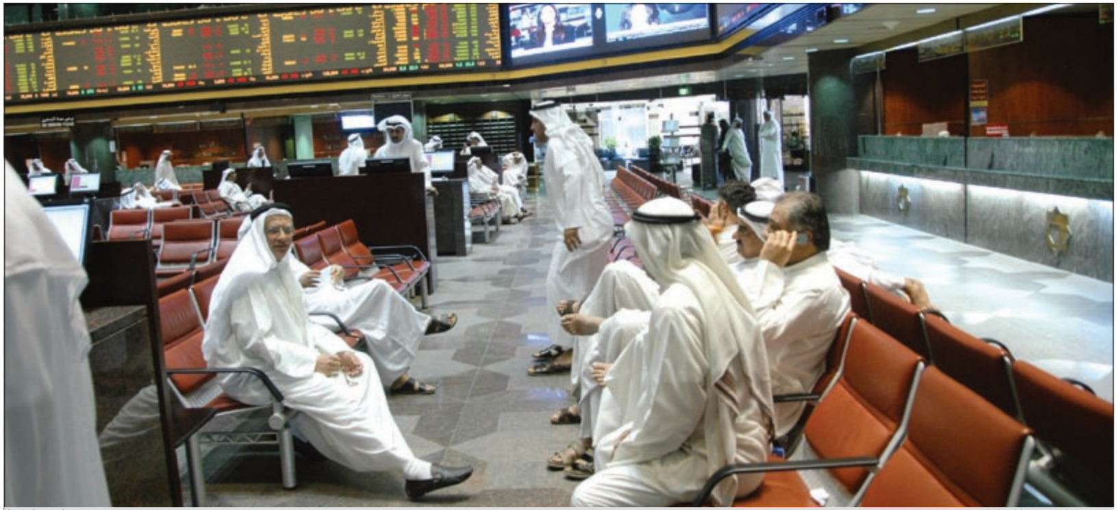
الإحباط يسود المتداولين

على الرغم من تجاوز سمسو رئيس مجلس الوزراء بشكل قوي موضوع طرح الثقة، إلا أن سوق الكويت للأوراق المالية لم يتفاعل أمس بشكل إيجابي مع هذا الموضوع السذي تزامن مع إعلان بعض أعضاء مجلس الأمة اعترافهم بتقديم استجواب آخر لرئيس الحكومة، الأمر الذي دفع مؤشرات السوق للتراجع وزاد من أجواء الإحباط لدى أوساط المتداولين الذين أقبلوا على البيع موقف نزيه الخسائر المتواصل.