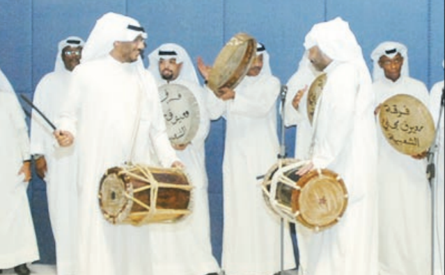
جانب من فقرات الفرقة

إصدار مجلة بعنوان «أمان يا مصر» لتوثق مراحل الرحلة. من جهته، أكد وزير سياحة جمهورية مصر العربية منير فخري عبدالنور أنه ومصر مدينتان لرئيس بيت الكويت للأعمال الوطنية يوسف العميري للدور الكبير الذي قام به والجهود التي بذلها وسعى فيها من أجل إنعاش السياحة في مصر من خلال مبادرته الصادقة النابعة من حبه للشعب المصري، مشيراً إلى الشاعر الفياض التي عبر عنها كل الكويتيين من كبيرهم صاحب السمو الأمير السى أصغرم والتي لمستتها خلال اليومين الماضيين لم أفسها في أي بلد آخر، فكانت مشاعر صادقة وحبا ومودة ومسؤولية تقدر أهمية مصر وأهميتها وضعها وحالتها الاقتصادية والسياسية.