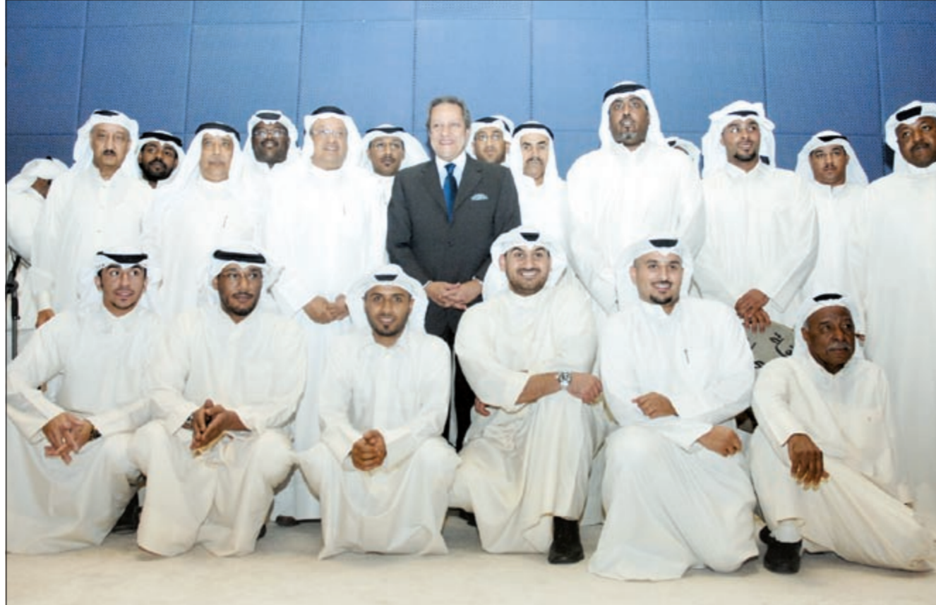
وزير السياحة المصري ورئيس بيت الكويت للأعمال الوطنية يتوسطان أعضاء فرقة «معيوف بن مجلي» للفنون الشعبية