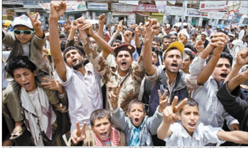
جنود يمنيون انضموا إلى المعارضين لصالح في صنعاء امس

العام اتهم في وقت سابق تحالف احزاب اللقاء المشترك (المعارضة) بالوقوف وراء افتعال الأزمات الاقتصادية وانقطاع الكهرباء ونقص المشتقات النفطية، ودعا وزارة الداخلية بسرعة الكشف عن هوية العناصر التخريبية التي تسببت في هذه الأزمات. وفي بيان صحافي للمؤتمر، سخر مصدر مسؤول في الأمانة العامة للمؤتمر مما وصفه بالكاذب والافتراءات - وذلك في إشارة لاتهام المعارضة للدولة بالوقوف وراء هذه الأزمات - التي تضمنتها البيان الصحافي لأحزاب اللقاء المشترك حول الأوضاع الاقتصادية والأزمات الراهنة.