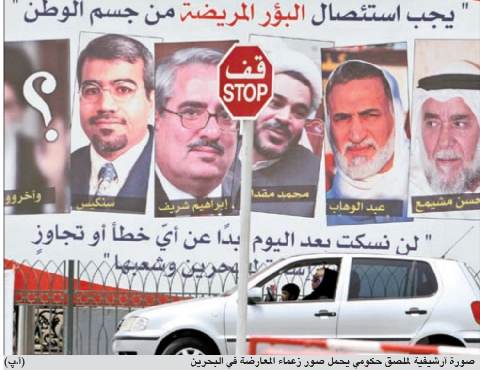
صورة أرشيفية للملك حاكمي يحمل صور زعماء المعارضة في البحرين

بحقهما الشهر المقبل. وجدد مرزوق التأكيد على أن جمعية الوفاق مازالت تروج بدعوة الصور لكن «لا يوجد قرار رسمي من الوفاق بالدخول في الحوار أو عدمه حتى الآن» على حد قوله.