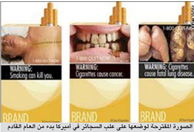
الصورة المقترحة لوضعها على علب السجائر في أميركا بدء من العام القادم

واشنطن - يو.بي.أي: كشفت إدارة الغذاء والدواء الأميركية الثلاثاء عن 9 صور تحذيرية توضيحية «مقززة» لسجائر شركات التبغ وضعها على علب السجائر كتحذير للمدخنين من أضرار التدخين. والصور التي ستوضع ابتداء من 22 أكتوبر 2012 على علب السجائر في أميركا وعلى إعلانات السجائر هي لجلث ورثتين تالفيتين مصابتين بالسرطان وأسنان سوداء فاسدة. وستحمل علب السجائر لونا محمدا إلى جانب الصور إضافة إلى تحذير يحمل واحدة من عدة عبارات مثل «التدخين إيمان» و«تدخين السجائر يمكن أن يلحق الضرر بأطفالك» و«التدخين يقتلك» و«التدخين يسبب السرطان» و«التدخين يتسبب بمرض الرئة القاتل» و«التدخين يسبب التهابات الصدرية وأمراض القلب». ومن بين العبارات أيضا «التدخين أثناء الحمل يلحق