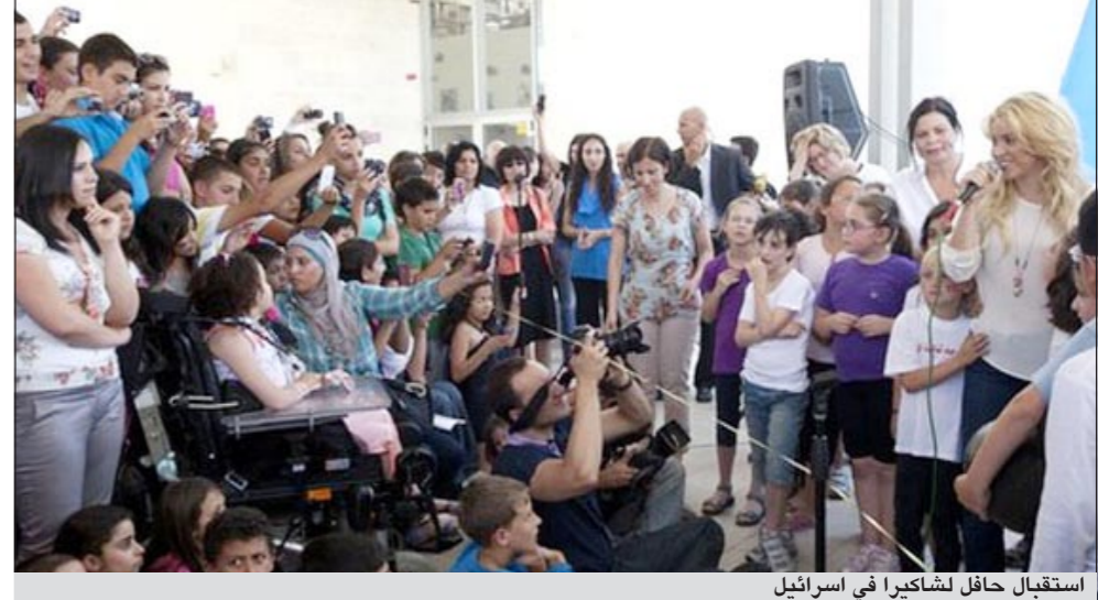
استقبال حافل لشاكيرا في إسرائيل

القدس المحتلة - وكالات: استقبل أطفال عرب ويهود بإحدى المدارس مزدوجة اللغة بالقدس المحتلة المطربة الكولومبية الشهيرة شاكيرا بترحاب بالغ فيما تحدثت المطربة اللبنانية الأصل بكلمات التحية باللغة العبرية، وذلك بعد يوم من صلاتها هي وحبيبها مدافع فريق برشلونه الإسباني جيرارد بيكه عند البراق (حائط المبكى عند اليهود) بالقدس. وردد الأطفال الذين ارتدى كثير منهم قميص النادي الإسباني أغنية «واكا واكا» الشهيرة في فناء المدرسة، وهنقوا باسم النجمة الكولومبية التي لم تتردد في معانقة كل ما طالت يدها منهم، وذلك خلال استقبالها للثناء الماضي.