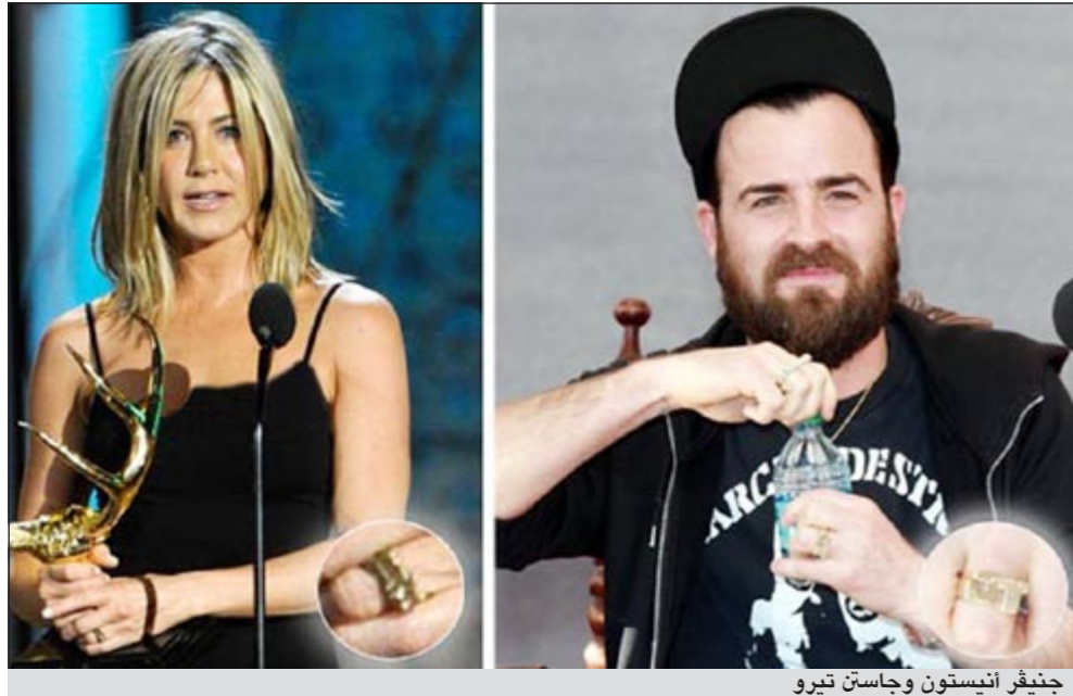
جنيفر أنيستون وجاستن تيرو

الجديد «جلالته» في أبريل الماضي. يشار إلى أن هذا الأمر يزيد من الشكوك باحتمال اتخاذ علاقة النجمين منحى جديا، خاصة أن تيرو انتقل مؤخرا للإقامة مع أنيستون في منزلها في لوس أنجليس. يذكر أن أنيستون مطلقة من النجم براد بيت وسبق أن أقامت علاقة مع المغني جون ماير إلا أنها انفصلا في العام 2008. وغادرت هابدي بيفنز حبيبة تيرو منذ 14 سنة منزلها المشترك قبل أيام قليلة من انتقاله للسكن في بيت أنيستون.