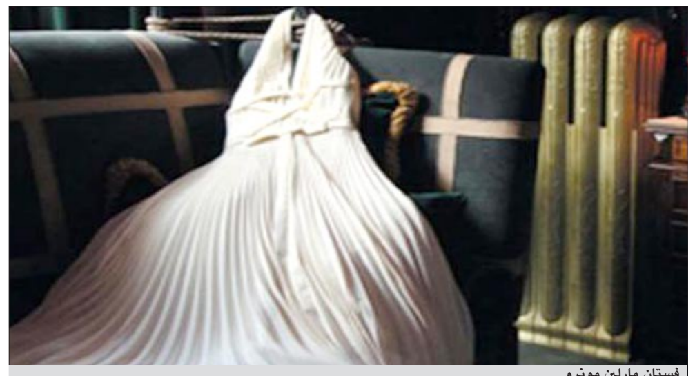
فستان مارلين مونرو

وعبر إعلاميون وعاملون في الوسط الفني الأمريكي عن استيائهم من المزاد، لتقريبه في مقتنيات قيمة للفنانين والفنانات، مشيرين إلى أن هذا التفريط حدث مع كنوز الحضارة اليونانية، كما سبق أن حدث مع إيطاليا، واليوم يحدث مع مقتنيات هوليوود. وأشار إلى أن المزاد العلني شهد بيع الفستان الأبيض الشهير الذي كانت ترتديه نجمة الإغراء الأميركية الشهيرة مارلين مونرو في فيلم «هرشة السنة السابعة» عام 1955، بمبلغ 4,6 ملايين دولار.