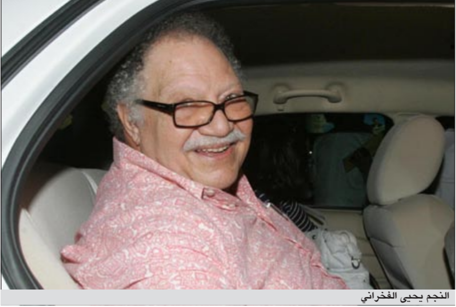
النجم يحيى الفخراني