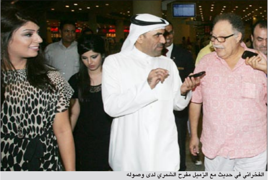
الفخراني في حديث مع الزميل مفرح الشمري لدى وصوله

التلفزيون الوفد الإعلامي الكويتي الذي زار مصر مؤخراً لدعم وتشجيع السياحة ولذلك قررت المجيء للكويت لرد الجميل لهذا الوفد، متمنياً للكويت وأهلها كل تقدم وازدهار. وأشار النجم يحيى الفخراني إلى أنه سيغيب عن شاشة رمضان هذا العام بعد أن تأجل تصوير مسلسله «بواقى صالح» الذي كتبه ناصر عبدالرحمن لأن عدداً من مشاهده لا بد من تصويرها في عدد من الدول العربية التي تشهد حالياً عدم استقرار، مشيراً إلى أن غيابه عن شاشة رمضان سيعطيه الفرصة لاختيار الأفضل من السيناريوهات لتقديهما لجمهوره العربي.