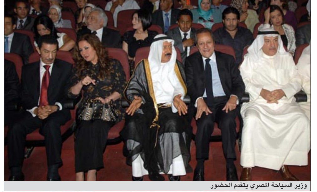
وزير السياحة المصري يتقدم الحضور

وسط هذه الأجواء التي أشعلتها «صبايا» الفرقة القومية للفنون الشعبية على