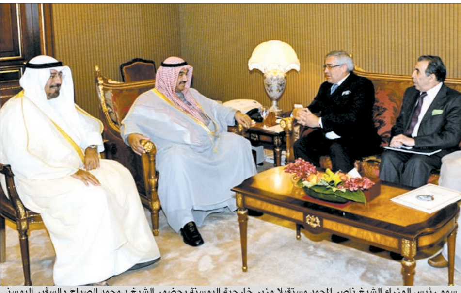
سمو رئيس الوزراء الشيخ ناصر المحمد مستقبلاً وزير خارجية البوسنة بحضور الشيخ د.محمد الصباح والسفير البوسني

البحوث وتنظيم الندوات وورش العمل والمحاضرات ذات العلاقة بسياسة الكويت الخارجية والعلاقات الدولية. وأبدى الوزير الكلاي اهتمامه الكبير بالتجربة الكويتية بهذا الخصوص، مشيراً إلى تشابه ظروف بلاده مع الكويت وتماثل مواقفها مع المواقف الكويتية مما يعزز إمكانية الاستفادة من التجربة الكويتية في مجال إنشاء معهد دبلوماسي في سراييفو وما ستشكل اليه من مهام.