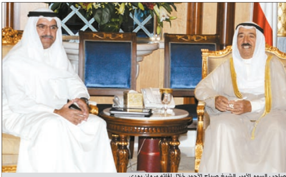
صاحب السمو الأمير الشيخ صباح الأحمد خلال لقائه مروان بودي