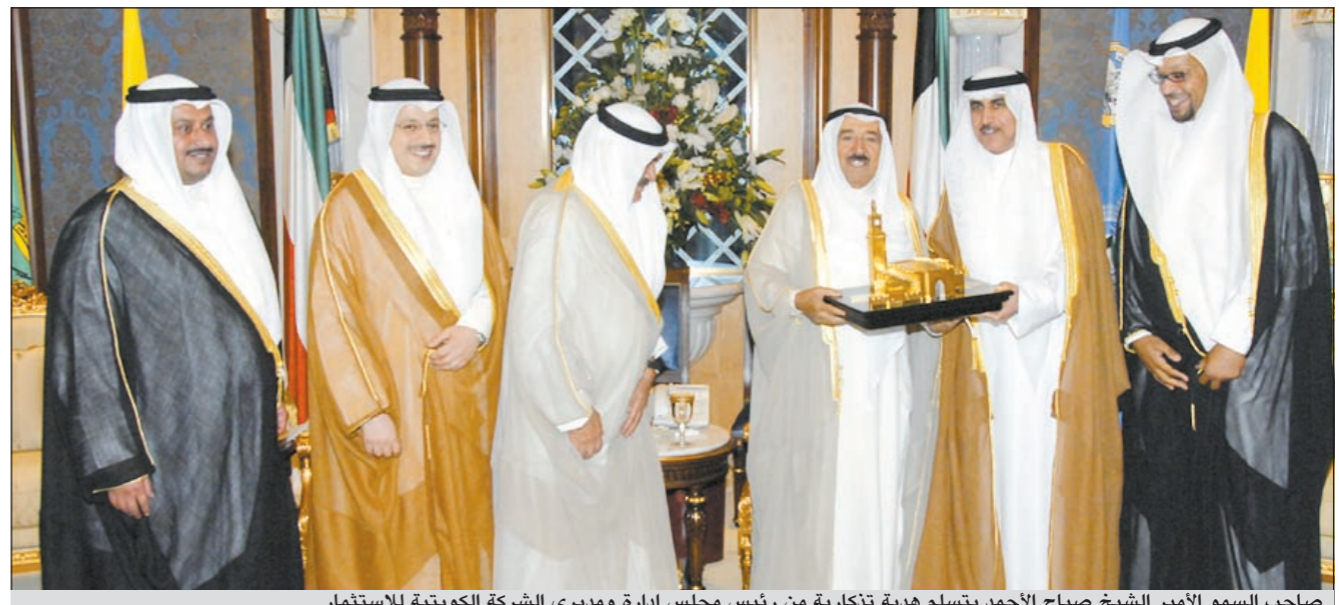
صاحب السمو الأمير الشيخ صباح الأحمد يتسلم هدية تذكارية من رئيس مجلس إدارة ومديري الشركة الكويتية للاستثمار

حضر المقابلة نائب وزير شؤون الديوان الأميري الشيخ علي الجراح. كما استقبل سموه بقصر بيان ظهر امس رئيس مجلس إدارة مجموعة طيران الجزيرة مروان بودي حيث قدم لسموه شرحاً