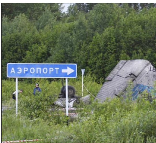
أجزاء من الطائرة المنكوبة قرب لافتة (المطار)

لكن نيكولاي فيدوتوف المسؤول في الأمن المدني في كاريليا، قال بحسب ما نقلت ايتار - تاس أن الطائرة التي قد تكون قامت بهبوطاً على محور خاطئ، تسببت بانذلاع النيران عند قطعها سلكاً كهربائياً ثم تحطمت على الطريق الجارٍ، وذكرت وكالة إنترفاكس أنه عثر على الصندوقين الأسودين للطائرة. واعرب الرئيس الفرنسي نيكولا ساركوزي عن تعازيه قبل لقاء مع رئيس الوزراء الروسي فلاديمير بوتين على هامش معرض الطيران في ليورجيه حيث تعرض روسيا لطائرة سوبرجيت-100 لتحل محل