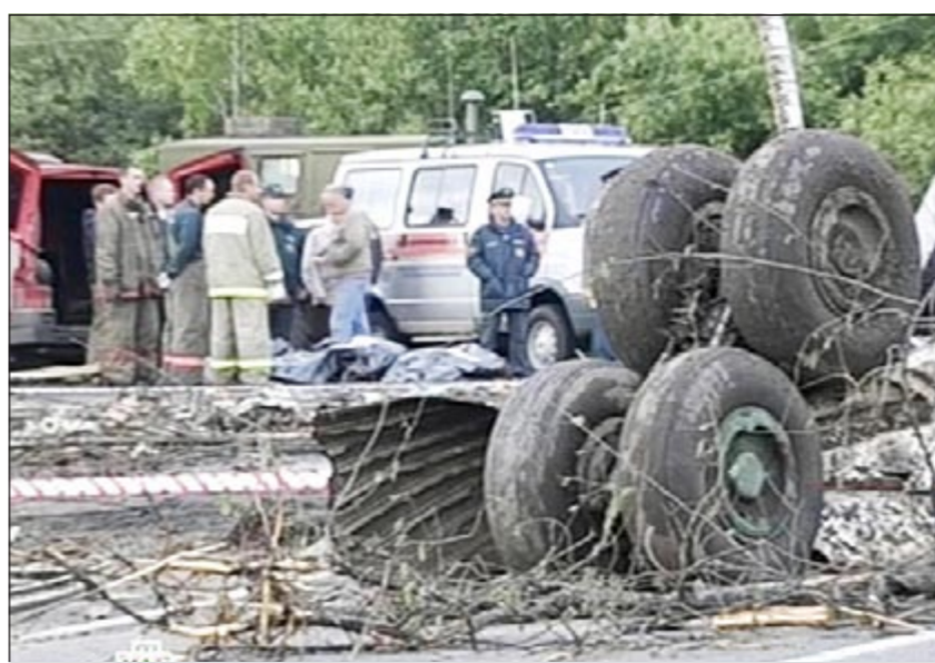
اطارات الطائرة وسط الطريق السريع

ويين القتلى مواطن سويدي وآخر هولندي وأوكرانيان بالإضافة إلى عائلة من أربعة أشخاص يحملون الجنسية الروسية والأميركية، بحسب وزارة الأوضاع الطائرة، وبين القتلى أيضاً الحكم الدولي فلاديمير بيتاي (38 عاماً)، وكان يبني يقود مباريات دوري الروسي منذ العام 2003 وأصبح العالم 2010 حكماً دولياً. وقد قاد الثلاثاء الماضي مباراته الـ100 في الدوري الروسي بين روبن كازان