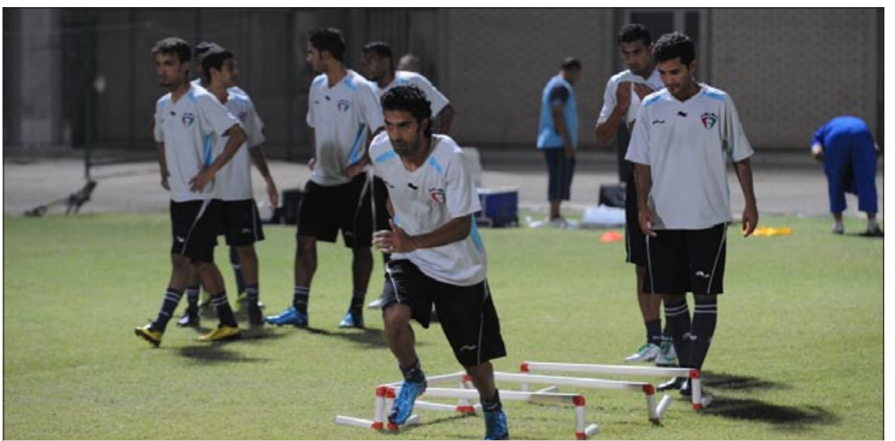
لاعبو المنتخب في احد التدريبات السابقة

يخوض منتخبنا الوطني لكرة القدم اليوم أول تدريباته في الـ 7:30 على الملعب الفرعي لسstad جابر الدولي ضمن استعدادات لخوض تصفيات كأس العالم المؤهلة لنهايات كأس العالم بالبرازيل 2014، وسيبدأ مشوار منتخبنا بمواجهة الفانم من منتخبني سربلندا والفلبين في 23 و 28 يوليو المقبل.