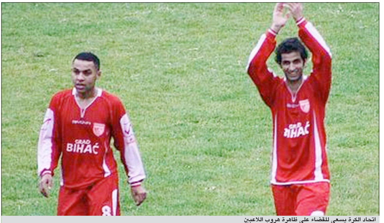
اتحاد الكرة يسعي للفضاء على ظاهرة هروب اللاعبين

ايضا على اتحاد الكرة بحجة التمييز وعدم المساواة. اما من جانب الاتحاد الدولي لكرة «فيفا» فهو لديه مبدأ بالوقوف مع عدم احتكار اي لاعب، كذلك يدعم ظاهرة يتعامل كلاعب كويتي بالمساواة مع بقية زملائه من دون ان تفرقه.