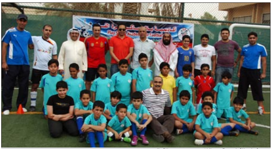
مسؤولو الأكاديمية مع اللاعبين وعدد من الأهالي

أعلن أول من أمس عن افتتاح أكاديمية «بلاي ساكر» لتعليم كرة القدم في ملاعب جمعية الأبطاء في الجابرية وبحضور الكابتن حسين الفيكاوي نجم النادي العربي سابقا والكابتن هاني شيرين من نادي الكويت وجانب من الشخصيات الرياضية وأولياء الأمور.