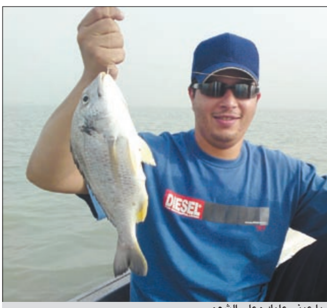
يا عيني عليك وعلى الشعم