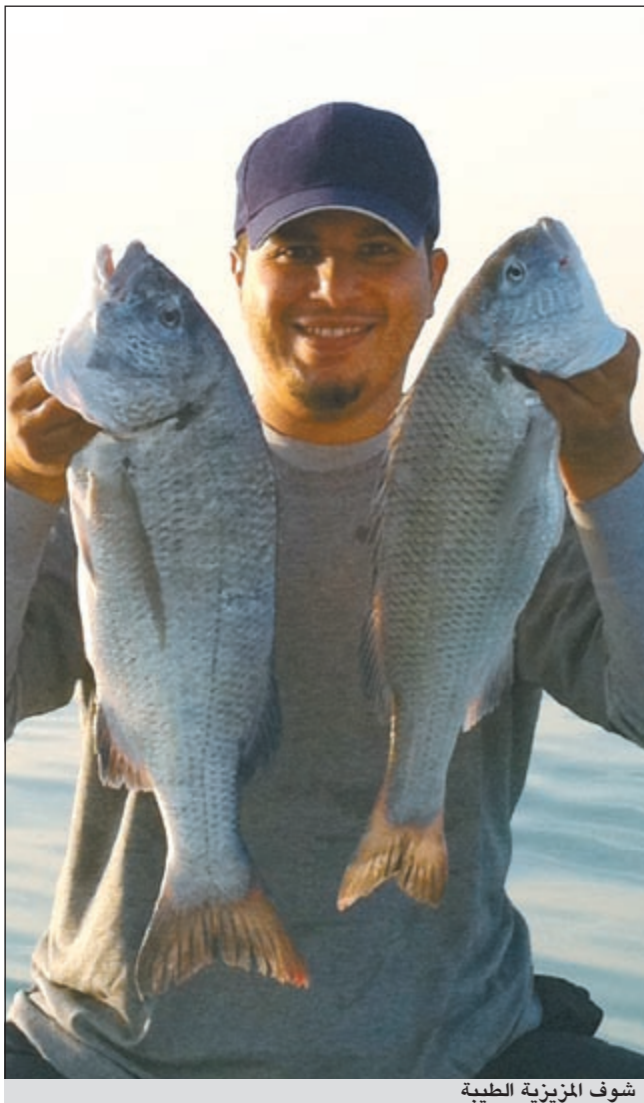
شوف المزيوية الطيبة