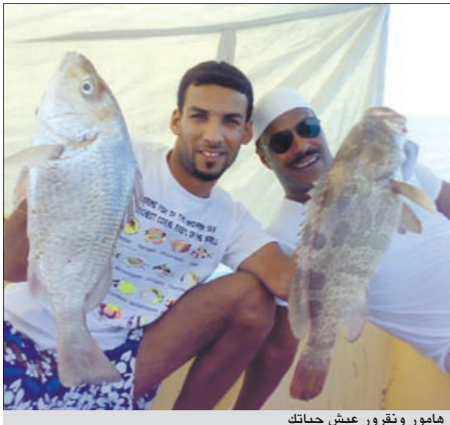
هامور ونقرور عيش حياتك