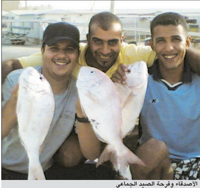
الأصدقاء وفرحة الصيد الجماعي