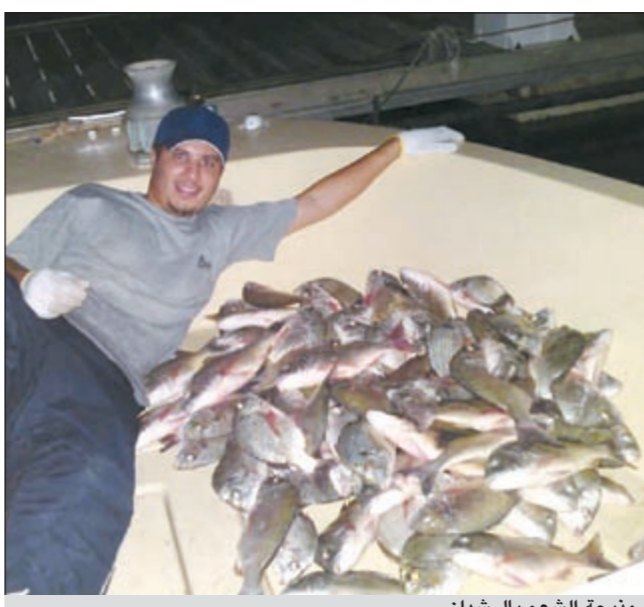
مذبحه الشعم بالرشدان

● احب ان اوجه دعوتي الى اخواني الحداق وارجو منهم الاهتمام بعودة السلامة والاستعانة الأولية كاملة دون نقصان، كما ادعوهم الى عدم رمي اللعب والأكياس الفارغة بالبحر وأيضا اوجه دعوتي الى المسؤولين وارجو منهم الاهتمام بشكاوى الحداق وما يعانون منه بسبب قلة المسنات وعدم وجود الخدمات بأغلبها وفي الختام ادعو للجميع بالصحة والصيد الوفير.