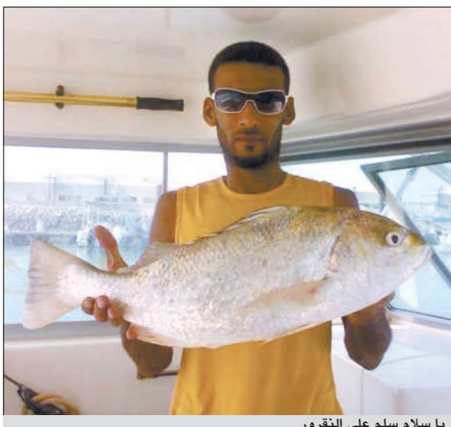
يا سلام سلم على النقرور