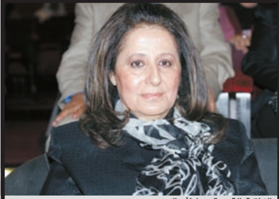
الكاتبة القديرة عواطف البدر