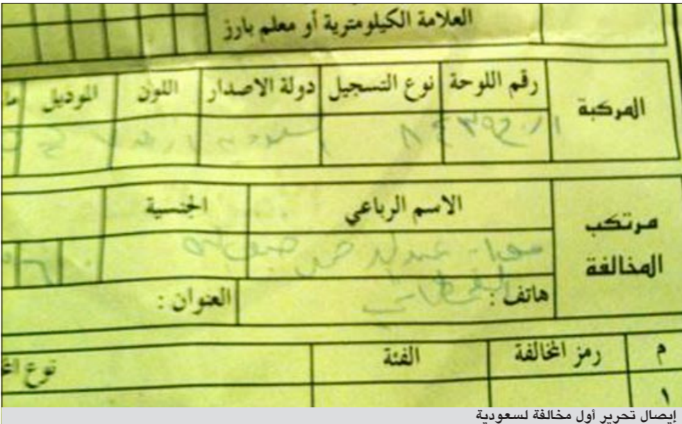
إيصال تحرير أول مخالفة لسعودية

7 سيارات، من بينها سيارتان للشرطة المدنية. وأوضحت أنه تم استدعاء زوجها إلى مركز الشرطة لإغلاق ملف القضية، وطلبوا منه الاعتذار والتوقيع على تعهد بعدم قيادتي للسيارة مرة أخرى. وتقول إن الهدف من تصوير مخالفة السيارة ونشرها عبر الإنترنت هو إيصال الرسالة إلى العالم بأنه بالفعل تم إيقاف سيدة سعودية، وليس لقيادتها للسيارة.