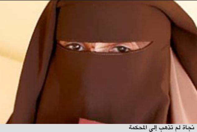
نجاة لم تذهب إلى المحكمة

وأشار الناطق إلى أنه تم حفظ الجثة بخلجة الموتى وجرى الإبلاغ للطبيب الشرعي للكشف عليها وتزويد جهة التحقيق بالتقرير الطبي اللازم، فيما لا يزال التحقيق جاريا مع زوجها لمعرفة أرق تفاصيل الحادثة البشعة.