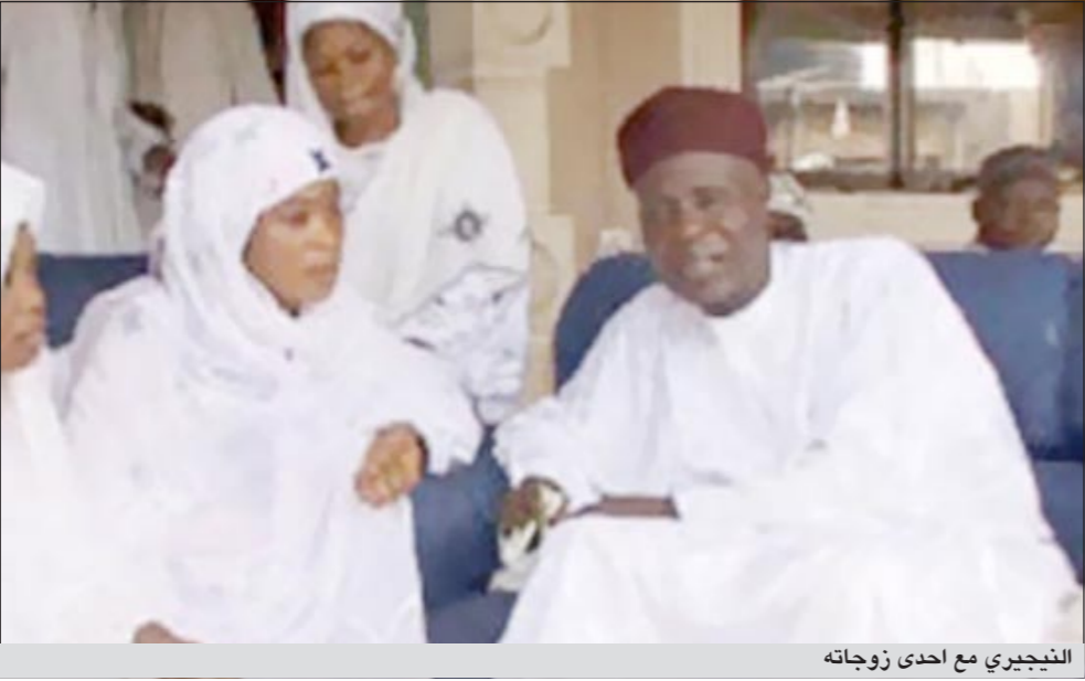
النيجيري مع إحدى زوجاته

ونضيف مسابا أن الرؤيا التي رآها حضرت عليه أيضا تناول الأدوية العصرية. وتعيش الزوجات الـ 90 وأولاده في منزل كبير. وتتشابه ملامح كل مولود صغير، لأنهم كافة من صلب رجل واحد. ومات 55 من أطفال مسابا في سن صغيرة.