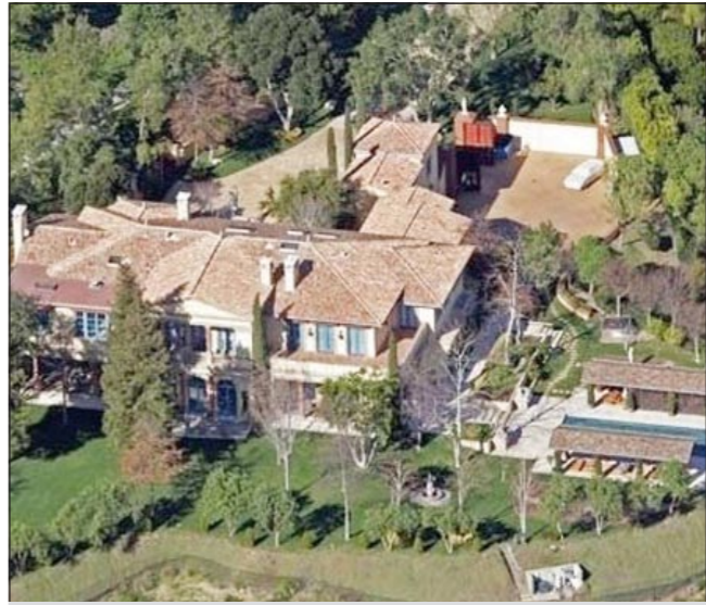
منزله في كاليفورنيا