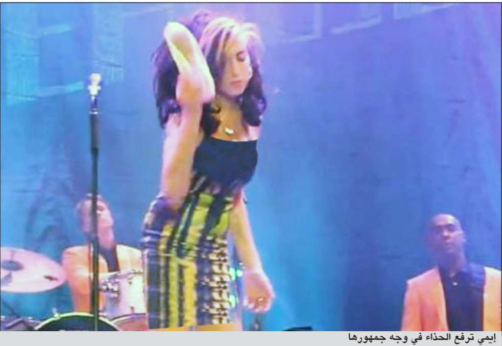
إيمي ترفع الحذاء في وجه جمهورها

مرهقة تعانق نفسها وتكر مسج أنفها خلال حفل السبت في بلغراد، وبلغ الأمر أن رشقت واينهاوس جمهورها بأحد نعلها ثم بحامل الميكروفون. وصفت وسائل الإعلام الصربية الحفل بأنه «فضيحة» و«كارثة».