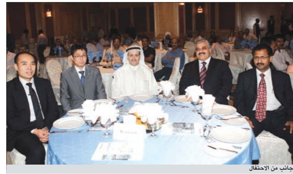
جانب من الاحتفال

لكي تحافظ على تبريد المكتب او المنزل من خلال اعادة توزيع الهواء في الغرفة وتجديده بشكل دائم حيث يمكن لعملائنا استخدامها الى جانب مكيفات الهواء التي تقدمها شركة باناسونيك او اي شركة اخرى وتأتي هذه المراوح ايضا بتصميمات أنيقة وعصرية وألوان مميزة تمكن عملائنا من اختيار ما يتناسب مع التصميم الداخلي وتصميم المفروشات داخل منازلهم ومكاتبهم. وبين ان شركة «عيسى حسين اليوسفي» اطلقت مجموعة جديدة من مراوح التهوية في الاسواق الكويتية ايضا والتي تلعب دوراً كبيراً في عملية إزالة المركبات العضوية المتطايرة في الهواء نتيجة استخدام باخاخ العناية الشخصية او الطلاء المنزلي او المذيبات الكيميائية او المبيدات العضوية وغيرها وما يضمن توزيع الهواء بشكل صحي واستمرار عملية تبديل الهواء بين الداخل والخارج.