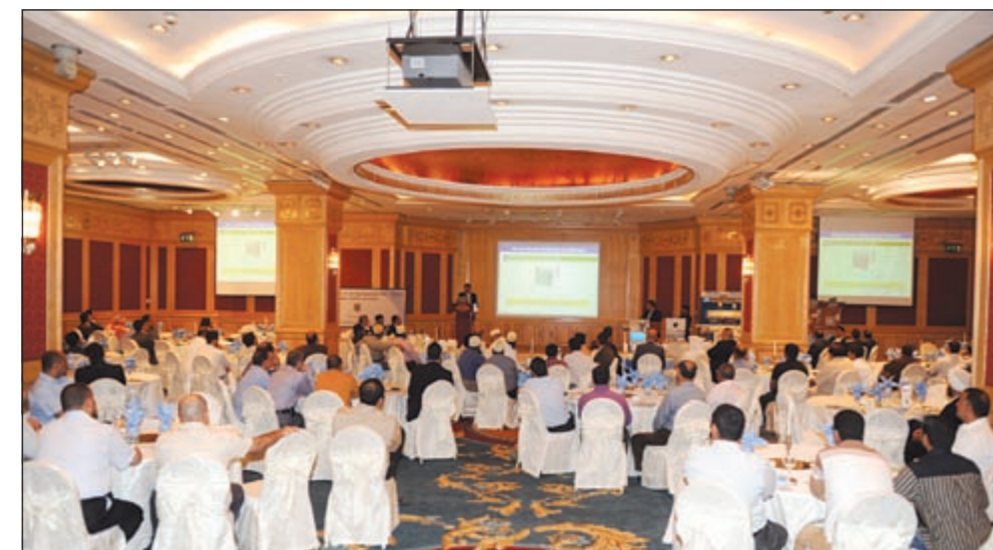
جانب من العرض التقديمي للمنتجات الجديدة بحضور موزعي باناسونيك

واضاف: ويمكن من خلال هذه المجموعة الجديدة ان تلبي مختلف احتياجات التهوية داخل المنازل سواء كانت لانظمة سحب الهواء او اجهزة سحب الهواء الخاصة بالمواقد او الستائر الهوائية، وقد طرحت شركة عيسى حسين اليوسفي نوعين جديدين من هذه المراوح والتي من شأنها تحسين جودة الهواء داخل المطابخ. واختتمت دبي قائلاً: لقد اصبحت مراوح التهوية المناسبة والفعالة من اهم الاجراءات اللازمة للحفاظ على التهوية السليمة التي تضمن نمط حياة صحي.