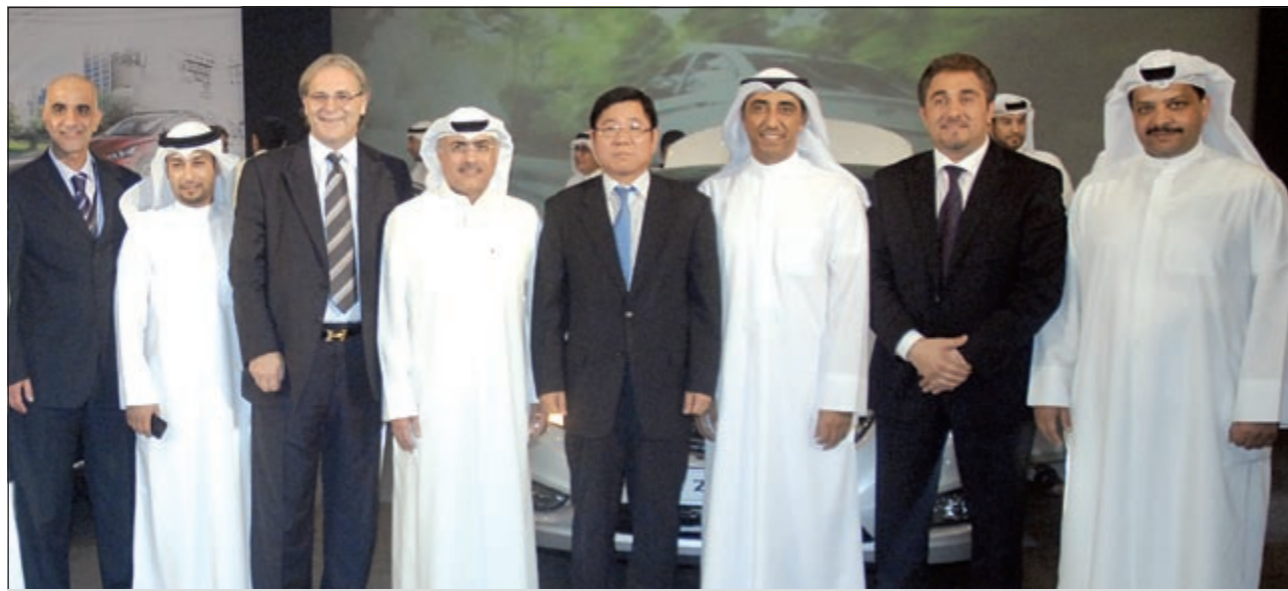
الخالد ومفلا «بيتك» و«هيونداي» في مهرجان الفئات الجديدة