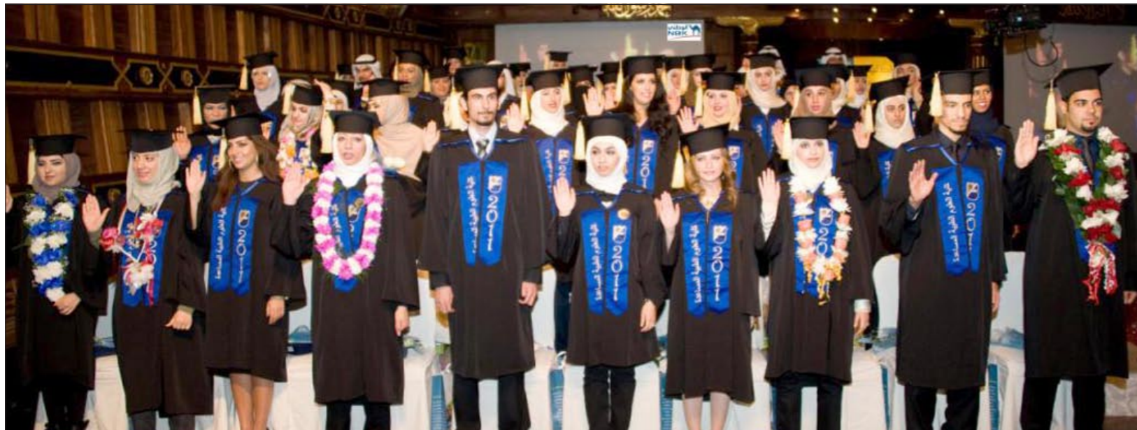
لقطة جماعية لخريجي كلية العلوم الطبية المساعدة

وأوضح بالقول: «في هذا الإطار، فإن حساب الشباب من البنك الوطني يلعب دورا مهما في رعاية وتنمية روح الاستزادة من العلم والتحصيل الدراسي الجامعي في صفوف الشباب الكويتي الذين يعدون الثروة الأهم للبلاد كما أثبتوا مرارا وتكرارا من خلال أنشطتهم ومواقفهم المهنية والإبداعية التي يتولى حساب الشباب عرضها وتقديمها للجمهور بصورة مستمرة». وفي الوقت الذي يشارك فيه حساب الشباب الخريجين فرحتهم فإنه يحرص على تكريمهم ومكافأتهم بجوائز قيمة. ويتميز حساب «الشباب» من «الوطني» بعروضه ومنتجاته المبتكرة والمعدة خصيصا لتلبية احتياجات عملائه من طلبة الجامعات والمعاهد العليا ممن تتراوح أعمارهم بين 17 و23 عاما. ويواصل حساب «الشباب» حملته الترويجية الهادفة إلى تشجيع ومكافأة السلوكيات الادخارية في صفوف الطلبة الشباب من خلال سحبواته الشهرية وربع السنوية التي تحمل العديد من المكافآت القيمة لعملائه الذين يحتفظون بأعلى أرصدة ادخارية في حساباتهم.