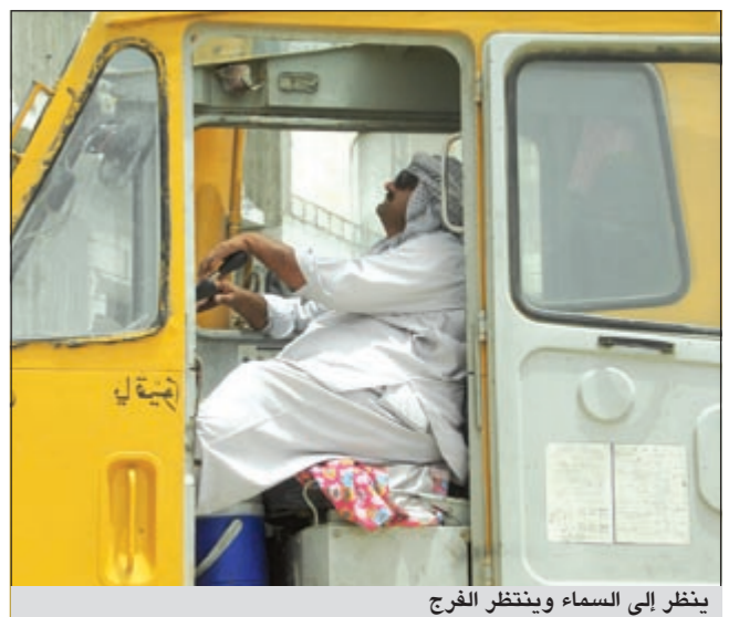
ينتظر إلى السماء وينتظر الفرج

وعن الأيتام ومجهولي الوالدين أكد الدوسري أن القانون الجديد راعي الظروف الاجتماعية الخاصة التي تمر بها تلك الفئة، إذ انه في ظل القانون القديم