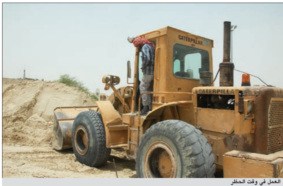
العمل في وقت الحظر

الالتزام بالحظر هذا العام ملحوظ بدوره أوضح رئيس الفريق