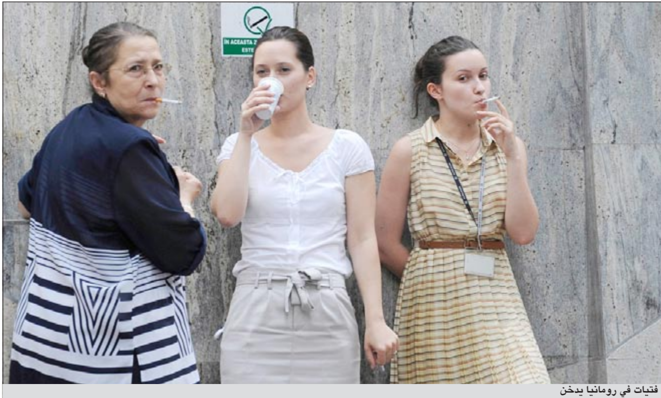
فتيات في رومانيا يدخن

وزير المالية بزيادة الضرائب على السجائر بنسبة 10٪. وحسب اليوم السابع يشتكي تجار التجزئة من الانتظار لساعات في طوابير أمام منافذ التوزيع ولا يجدون حصتهم المعتادة من السجائر إلى جانب تعرض العديد منهم لضرب أو تهديد بالسلاح في 15 عاما كانوا يدخنون يوميا في 2009، مقارنة مع 36٪ في 2003.