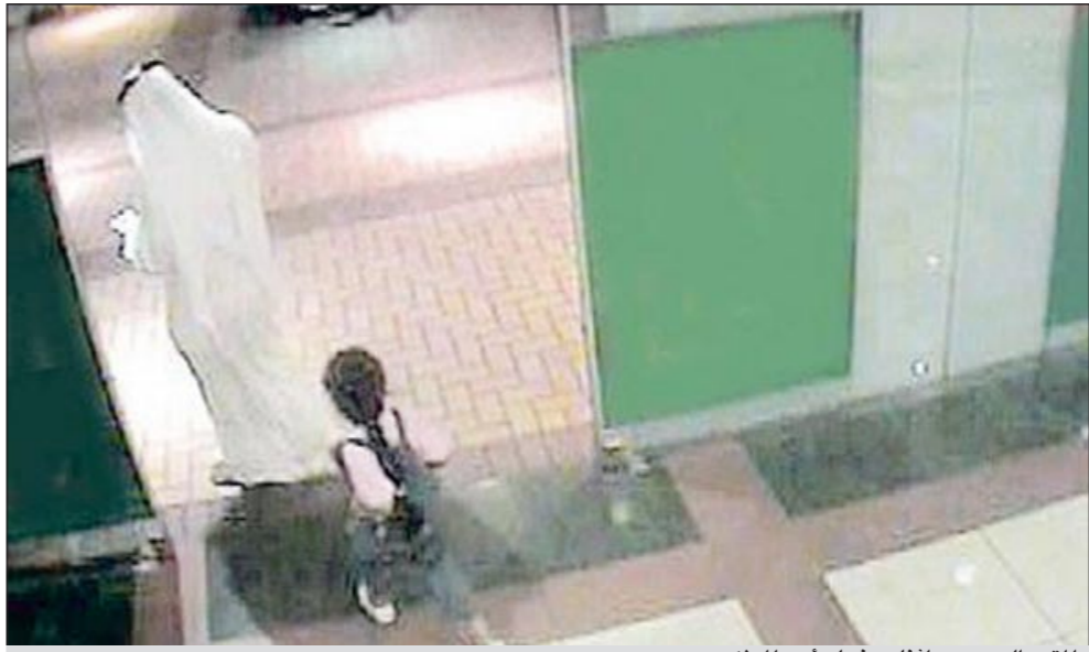
المتهم السعودي اثناء دخوله أحد المولات

ويشدد المستشار القانوني على أن تآثر القاضي بما يقال في الإعلام يعتمد على مدى استيعاب القاضي ذاته، ويقول: «التآثر بما يقوله الإعلام يعتمد على