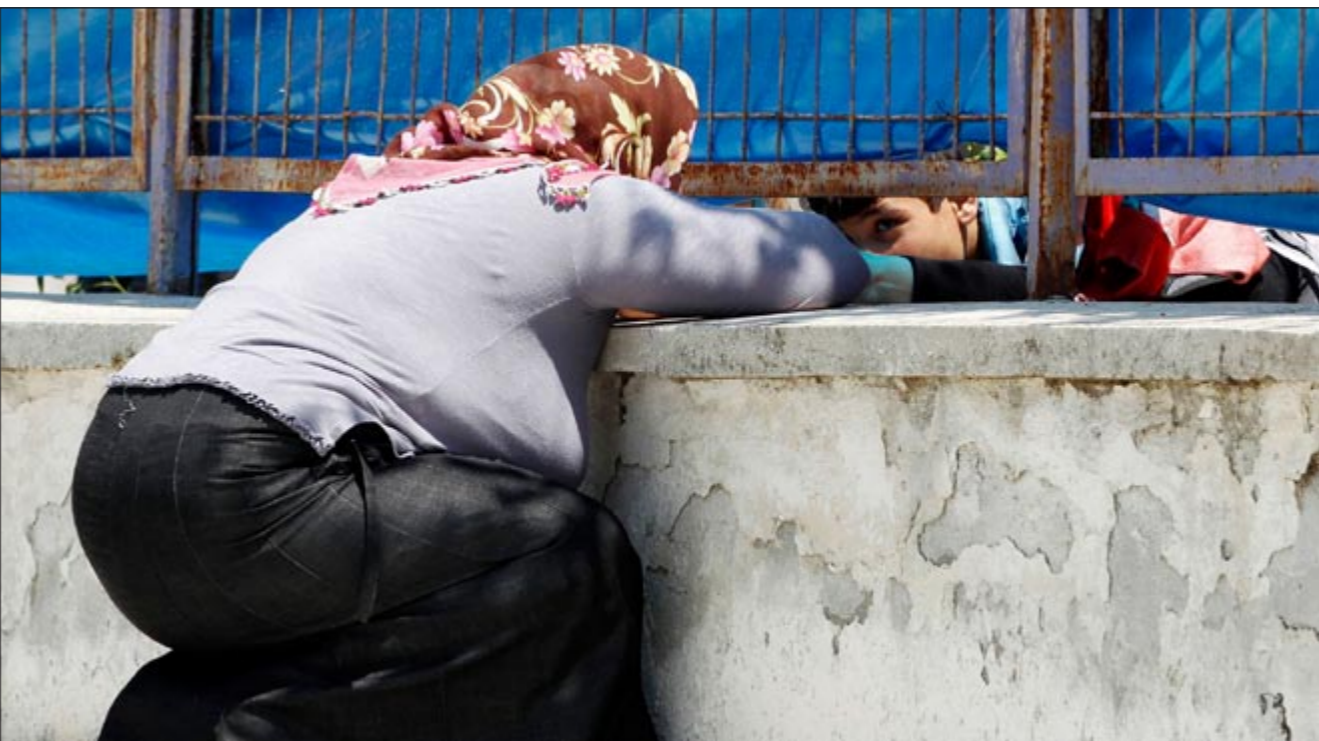
سيدة تركية تتحدث مع أحد اقاربها من اللاجئين السوريين عبر السياج في مخيم بيايلا داغي

وهي المرة الأولى التي تقوم فيها السلطات التركية بعملية مساعدة عبر الحدود، بعد ان استقبلت خلال اسابيع في الأراضي التركية أكثر من عشرة الاف لاجئ سوري هربوا من القمع في بلادهم. وقد احتشد الآف السوريين على الحدود مترددين في العبور إلى الأراضي التركية. واقام معظمهم في ظروف معيشية صعبة في خيام اعدت على عجل. وأوضح المكتب الحكومية ان عدد اللاجئين السوريين في سورية بلغ أمس 10553 بعد وصول 585 شخصا وعودة 146 آخرين طوعيا إلى سورية.