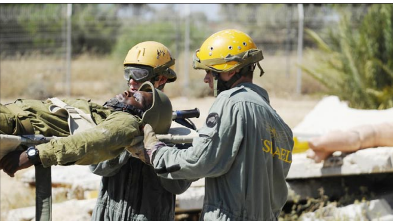
جنود إسرائيليون يتدربون على إخلاء مبنى خلال مناورات لمواجهة أي هجمات صاروخية محتملة (آ.ف.ب)

أي فرد يفكر مرتين قبل التفكير في شن هجوم ضدها»، ولكنه أضاف أن بلاده «يجب أن تكون مستعدة أيضا للمسياريوهات