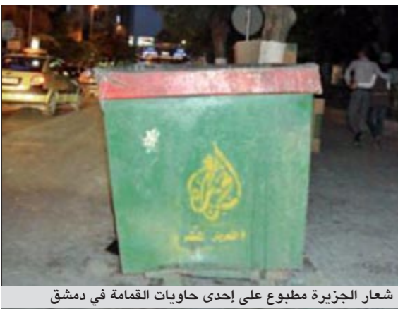
شعار الجزيرة مطبوع على إحدى حاويات القمامة في دمشق

تنتهيها محافظة دمشق هذه الأيام بحاويات القمامة الخضراء التي أعادت توزيعها من جديد في شوارع العاصمة وأزقتها، أما سر هذا الخبر فهو ان هذه الحاويات جاءت مجهزة بشعار قناة «الجزيرة»، وقد كتبت تحته عبارة «التحرير المستمر» بحسب جريدة «الأخبار» اللبنانية. وعلى الرغم من ان الرواية الرسمية السورية، تصر على ان معظم القنوات العربية الإخبارية تميل نحو التحريض والتجيش والفتنة في مقاربة الاحتجاجات الشعبية في البلد، طال «الجزيرة» النصب الأكبر من الشتائم والحمولات المضادة، هكذا تحولت الفضائية القطرية بين ليلة وضحاها، من صديقة لسورية، وداعمة لمواقفها، الى محرصة على الاحتجاجات والتظاهرات، والتي مساهمة أساسية في نشر الفوضى، وبالتالي انتقلت من مصدر ثقة مطلقة كان يتمتع بجمهورية ساحة في الشارع السوري الى ملهمة لايتكار أنواع جديدة من.. الشتائم! ولم يتم الاكتفاء بالقمامة بحسب جريدة «الأخبار» اللبنانية لإنبات مدى الحق السوري من المحطة، فبعد طبع الشعار على حاويات النفايات، سُخِّفَت عبارة «الرأي والرأي الآخر» التي تطرحها القناة شعرا لها، إذ طبع الشعار الشهير على أرضية الأماكن الأكثر ازدحاما في دمشق كالأسواق وغيرها، حتى أنه طبع على أرضية قصر العدل الذي داس كل من دخله منذ أيام على «الجزيرة» وشعارها، وقد تفتن كثيرون في ابتكار وسائل تسخر من الفضائية القطرية وتتهمها بالعمالة والخيانة والكذب، صحیح ان المتابع يلاحظ الارتباك الذي وقعت فيه المحطة القطرية عند بدء الاحتجاجات في سورية، الا ان وضع شعار «الجزيرة» على الحاويات اعتبره كثيرون خطوة مراهقة تصل الى درجة الابتذال.