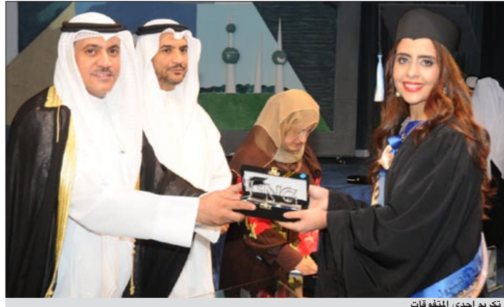
تكريم احدى المتفوقات