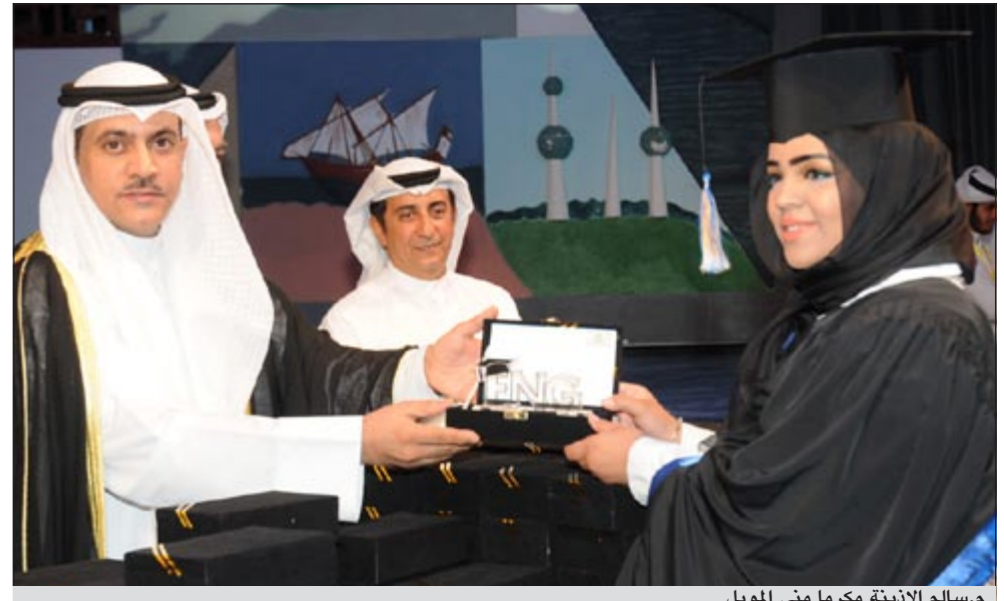
م. سالم الأذينة مكرما منى المويل

فيما جاء مشروع الهندسة المدنية «power generator sand» في المركز الثاني بينما حقق المركز الثالث مشروع قسم هندسة الكمبيوتر «hand-free text». وبدوره قال نائب رئيس جمعية الهندسة والبتترول أحمد الحميداني إن الجمعية تشجع المهندسين على التنافس الشريف فيما بينهم عن طريق إقامة هذه المسابقة الفريدة من نوعها، موضحاً أن هذه المسابقة كانت ضمن برنامج الجمعية التشجيعي. وفي الختام أكد عضو جمعية الهندسة والبتترول فواز الهرشاني أن تكريم الطلبة المتفوقين ما هو إلا وسام شرف لأعضاء جمعية الهندسة والبتترول شاكرًا وزير الكهرباء والماء سالم الأذينة على رعايته الكريمة متمنياً النجاح للطلبة المتفوقين في حياتهم. ● سعود المطيري