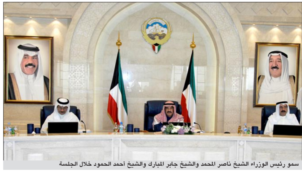
سمو رئيس الوزراء الشيخ ناصر المحمد والشيخ جابر المبارك والشيخ أحمد الحمود خلال الجلسة

كما أحيط المجلس علماً بقبول صاحب السمو الأمير الاستقالة التي تقدم بها نائب رئيس مجلس الوزراء ووزير الدولة لشؤون الإسكان ووزير الدولة لشؤون