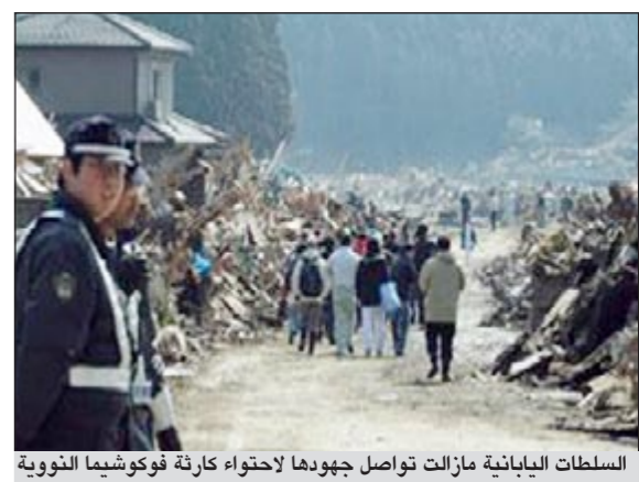
السلطات اليابانية مازالت تواصل جهودها لإحتواء كارثة فوكوشيما النووية

طوكيو - سي.ان.ان: بعد أقل من خمس ساعات على بدء تشغيل نظام جديد لتفكيك المياه الملوثة بمستويات عالية من الإشعاع في محطة «فوكوشيما دايتشي» للطاقة النووية، اضطرت السلطات اليابانية إلى وقف النظام بعد أن بلغت إحدى القطع الحد الأقصى للتعرض الإشعاعي.