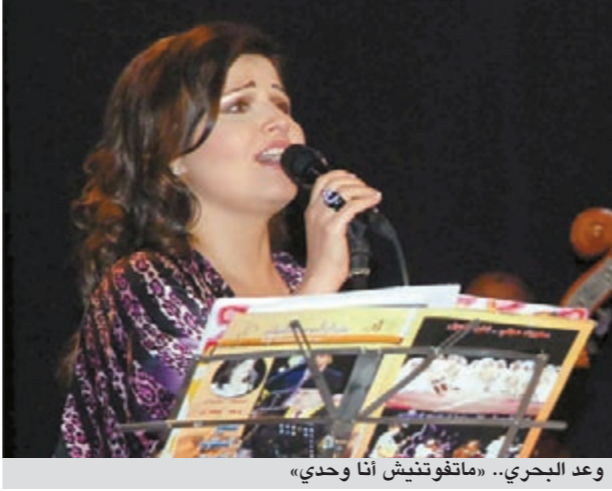
وعد البحري.. «ماتقوتيش أنا وحدي»

أكد الفنان راغب علامة أنه لا ينتمي إلى أي تيار سياسي، وقال في تصريح لجريدة الأخبار: مشاركتي في هذا المهرجان، وفي «الأشرفية» تحديدا، تعني أمرا واحدا، هو أن الجمهور من مختلف توجهاته السياسية سيكون معي ويشاركني في الحفلة، اسم المهرجان «عيش الأشرافية»، وهو ترفيهي وفني فقط، لا غير. وبالحديث عن السياسة، أكد راغب علامة أن تسلمه لحقيبة وزارية أمر بعيد عنه في هذه المرحلة، وأضاف: ما تردد كان مجرد شائعات نفيتها أكثر مرة، أنا فنان لكل اللبنانيين، ولست طائفيًا، ولاسلف، فإن من يرغب في أداء دور سياسي في زمننا هذا مجبر على اتخاذ الطائفية مذميا له، وإلا فلن يجد له مكانا. أرى كل الأطراف السياسية متحدة، وما يحصل اليوم في لبنان لعبة سياسة لا أفهمها ولا أحب أن أعرفها، وكل ما يهمني أن أفكر في لبنائيتي ومصير وطني، بالإضافة التي يمكن أن أمنحها أنا وزملائي القانون اللبناني من الناحيتين الفنية والثقافية.