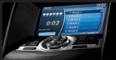
نظام Bose للترفيه الصوتي بـ 9 مكبرات صوت ومبدل لـ 6 أقراص وممثل ملفات MP3 و WMA