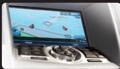
نظام نيسان الملاحي بالقرص الصلب