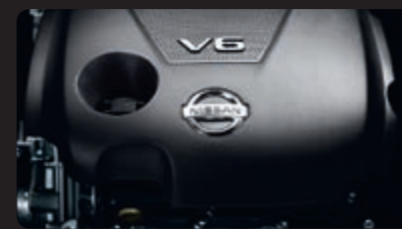
محرك VQ 3.5 لتر 290 حصاناً