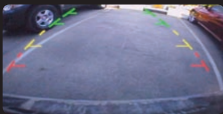
شاشة الرؤية الخلفية