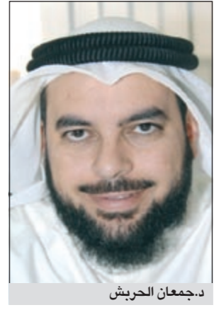
د. دجمعان الحربش

شدد النائب د. دجمعان الحربش على ضرورة استجابة الحكومة وتنفيذها لجميع المطالبات والتوصيات التي تضمنتها والتي وقع عليها 28 نائباً بشأن القطع والتجميد الفوري للعلاقات الدبلوماسية مع النظام السوري الذي أخذ في التمدد يوماً بعد يوم بارتكاب إبشع الجرائم ضد الإنسانية، وأكثرها دموية، واعتماداً لأسلوب الترويع والإبادة بحق الشعب السوري الاعزل، مشيراً إلى ان هذا النهج الدموي الذي يصير ويستمر فيه، النظام السوري يدفع به سريعاً إلى العزل