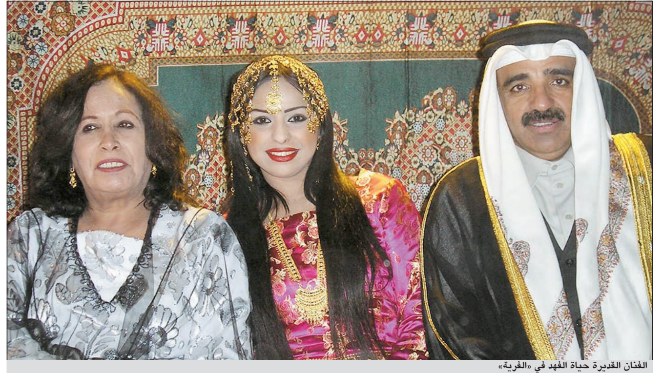
الفنان القديرة حياة الفهد في «الفرية»