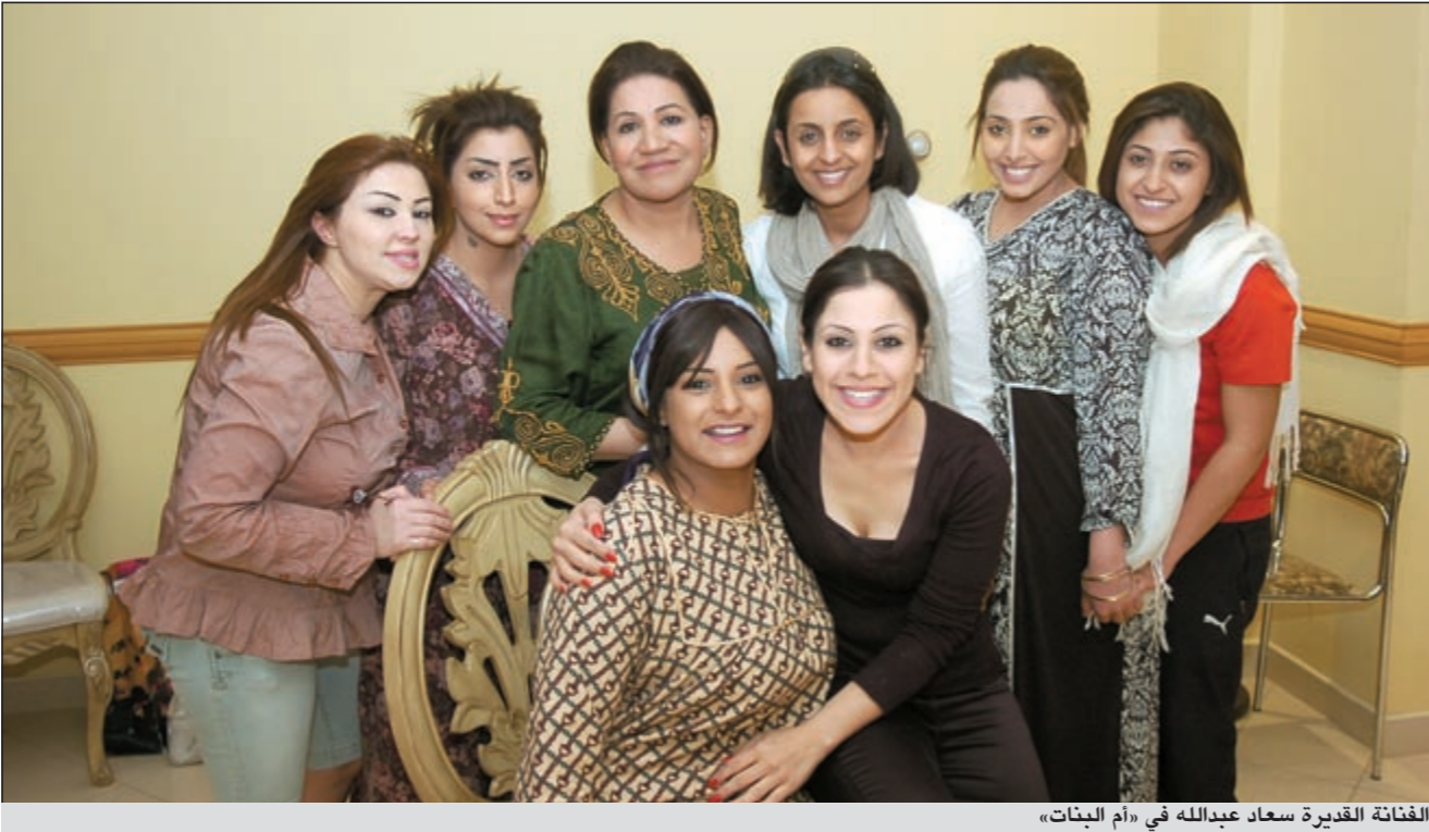
الفنانة القديرة سعاد عبدالله في «أم البنات»