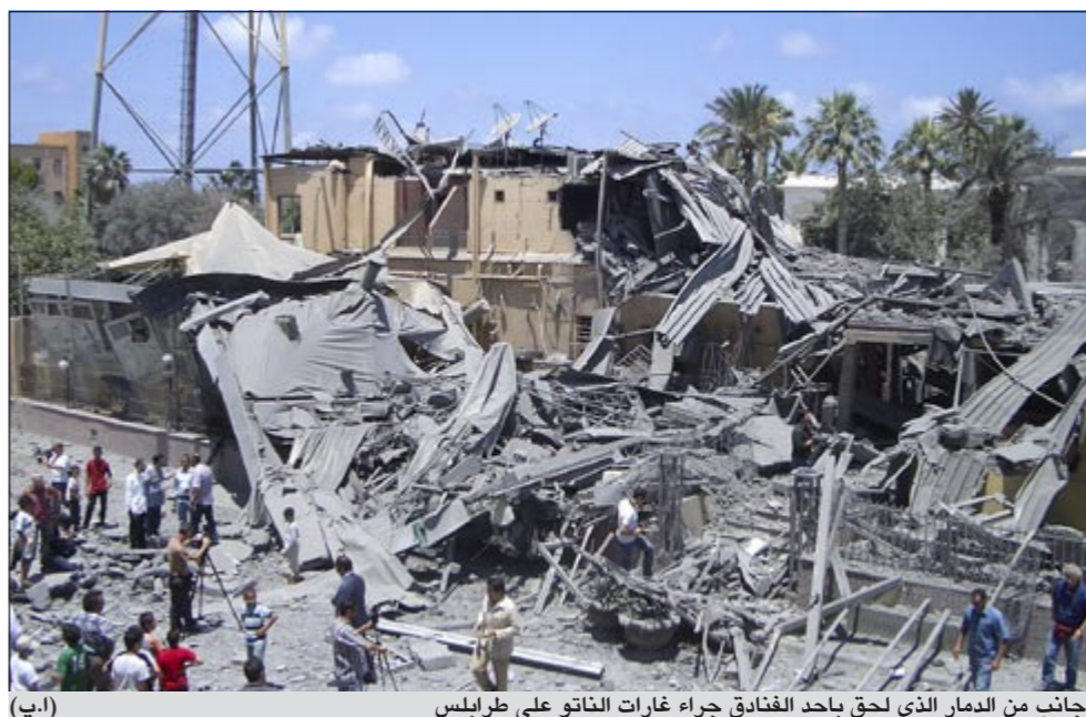
جانب من الدمار الذي لحق بحد الفنادق جراء غارات الناتو على طرابلس

ولا أخفى اهتمام موسكو بالأخبار والبنية التحتية المغلقة، وربما كان للروس اليوم الورقة الراحلة في ليبيا في هذا المجال». ورأى سيف الإسلام القذافي ان «الحل الأفضل والأقل ألما للخروج من الوضع الراهن في البلاد هو إجراء الانتخابات وبسرعة تحت إشراف دولي». دعوة سيف الإسلام فرنسا لإيجاد مخرج لازمة الليبية قبله إعلان باريس أمس قبولها مشاركة ممثلين عن النظام في