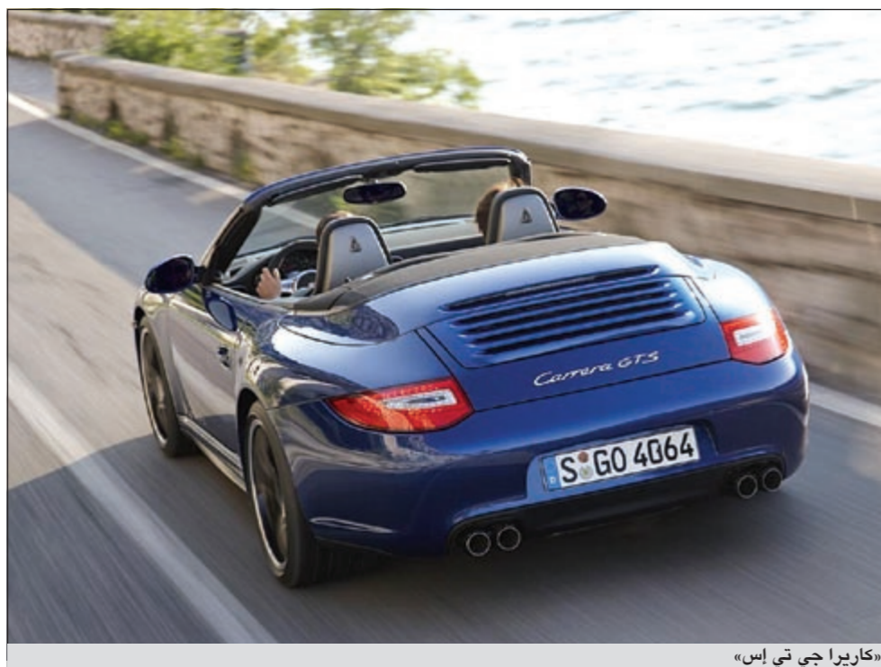
«كاريرا جي تي إس»

كما أظنقت بورشه فيها على ثلاثة مراكز أولى أخرى، كانت من نصيب «كايمن آر» Cayman و«بوكستر إس» Boxster S و«باناميرا توربو» Panamera Turbo. وتعزز هذه النتيجة موقع بورشه في الصدارة، خاصة أن أحدًا من الصانعين لم يقترب من إحراز هذا العدد من المراكز الأولى قط، حيث يذكر أنه في العام 2010، حصلت «تروفنفاوسن» ثلاث مراتب أولى.