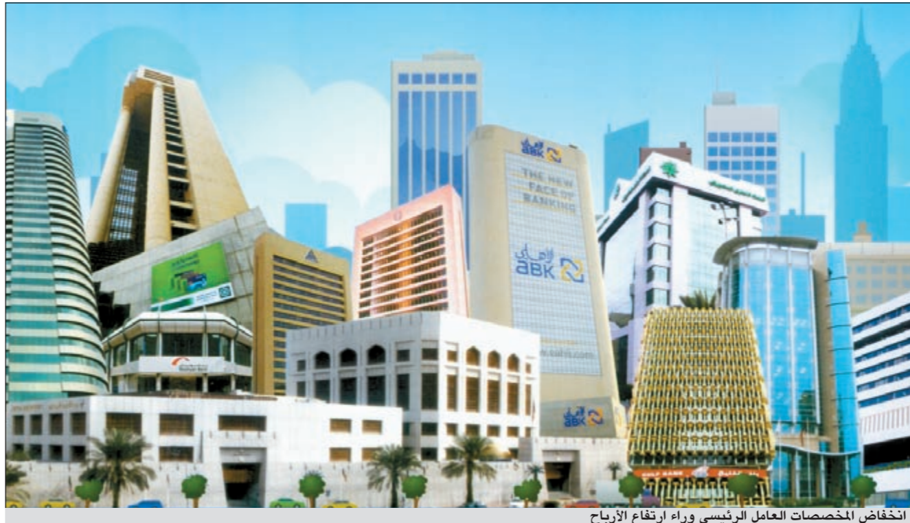
انخفاض المخصصات العامل الرئيسي وراء ارتفاع الأرباح

وأكدت ان المجتمعين اتفقوا على أنه خلال كل ستة أشهر سيتم إعادة تقييم مدى قابلية كل دولة لتوحيد هذه الأنظمة وأنه بعد سنتين من ذلك سيكون هناك تقييم