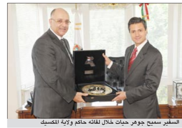
السفير سميح جوهر حيات خلال لقائه حاكم ولاية المكسيك

الاموال. وقال ان حيات شرح لحاكم الولاية الفرص الاستثمارية في الكويت داعياً المستثمرين المكسيكيين الى ان يطلعوا على تلك الفرص وعرض ما لديهم من مشاريع يمكن للقطاع الخاص المشاركة فيها.