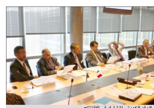
الوفد الكويتي المشارك في الافتتاح

للطاقة النووية السلمية وتقديم مقترحات حوله حيث تم شرح مفصل للنظام النووي الفرنسي من الناحية المؤسسية والصناعية والأكاديمية. واستعرض الاجتماع الدروس المستخلصة من حادثة محطة فوكوشيما اليابانية والتعاون الكويتي - الفرنسي في مجال الطاقة النووية السلمية من ناحية الدراسة او الخبرة الفرنسيين ومجال الاستثمار في شركة «أريفا» الفرنسية للطاقة النووية والتدريب الأكاديمي.