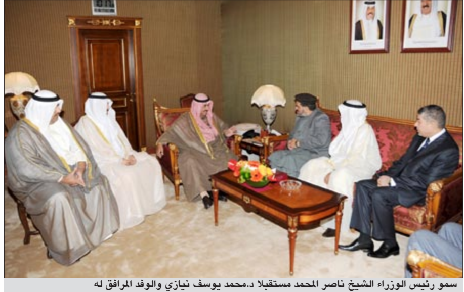
سمو رئيس الوزراء الشيخ ناصر المحمد مستقبلاً د. محمد يوسف نيازي والوفد المرافق له

رئيس مجلس الوزراء د. اسماعيل الشطي، وزير الإرشاد والحج والأوقاف بجمهورية أفغانستان الإسلامية الصديقة د. محمد يوسف نيازي والوفد المرافق له بمناسبة زيارته للبلاد. حضر المقابلة وزير الأوقاف والشؤون الإسلامية محمد النومس والوكيل بديوان سمو رئيس مجلس الوزراء الشيخ فهد جابر المبارك.