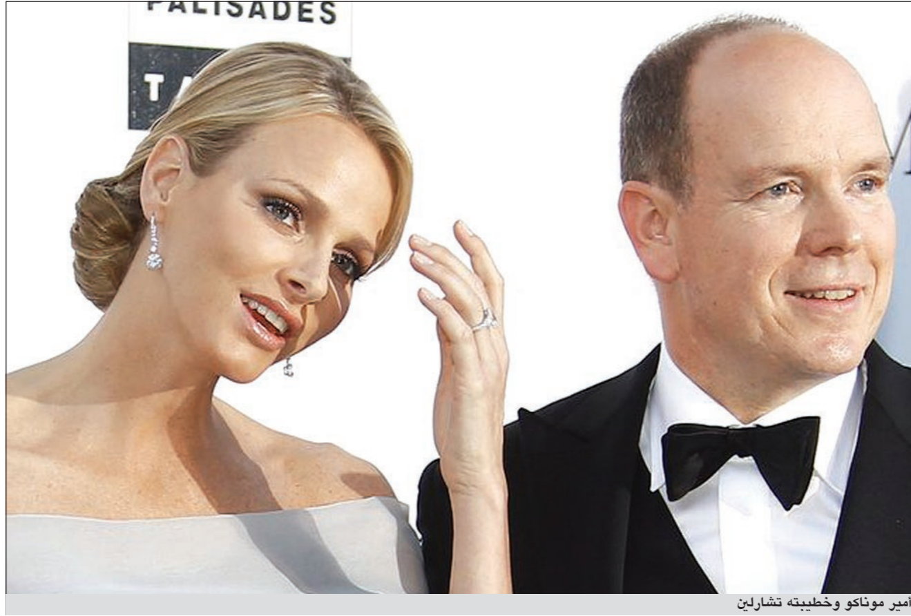
أمير موناكو وخطيبته تشارلين

الذي يجب ان تلعبه تشارلين بعد الزواج فقد قال الأمير ان زوجته ستعمل في المجال الخيري مع شقيقته كارولين وستفاني. وأضاف الأمير ان شقيقته كارولين ترعى رياضة الباليه فيما تهتم شقيقته ستفاني بمنظمة خاصة بمرضى الإيدز وقال ان تشارلين ستولي الاهتمام بالصليب الأحمر في موناكو أو بأولمبياد أصحاب الحالات الخاصة.