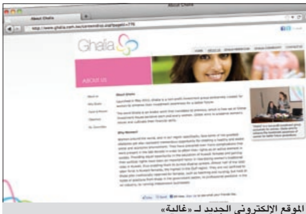
الموقع الإلكتروني الجديد لـ «غالية»

يذكر أن نادي غالية يهدف إلى تحقيق رسالة نبيلة لخدمة المجتمع عن طريق التفاعل مع العضوات بشكل مستمر ومنظم من خلال تمكين عضوات النادي اللاتي يبحثن عن المزيد من الإلمام والمعرفة في المجالات الاقتصادية والمالية، كما يركز النادي على ثلاثة محاور رئيسية هي التعليم والتدريب من خلال دورات فنية متخصصة عن إدارة الأموال والحقوق القانونية ومبادئ الإدارة، وبناء شراكة للتواصل بين السيدات وقطاع الأعمال وتوفير مركز للمعلومات، بالإضافة إلى تطوير مهارات الأجيال القادمة من خلال أساليب عديدة متطورة تساعد على صقل مهاراتهم وتعزيز خبراتهم.