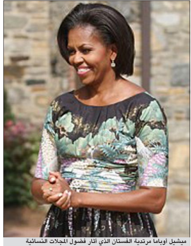
ميشيل أوباما مرتدية الفستان الذي أثار فضول المجلات النسائية

نيكلوديون، حيث ستدافع عن أسر الجنود، عبر تقديم مساعدة على النظر بطريقة مختلفة إلى الأسر التي تخدم الولايات المتحدة، هي أسر «قوية» لا تشتكي ولا تطلب الكثير.. وستشارك أوباما، خلال زيارتها إلى لوس أنجلوس، في حلقة من مسلسل تلفزيوني تعرضه قناة