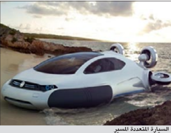
السيارة المتعددة المسير

كبقية السيارات، ويضخ المحرك الأول الهواء على الأطراف، فيما يعمل المحرك الثاني كقوة دافعة في شتتي الاتجاهات. وقالت مصممة السيارة لموقع «كار سكوب» إن الأكياس الهوائية «تساعد السيارة على السير بنسوة فوق المسطحات الصعبة، كالجليد، والمياه، والرمال.» وتمنت أن يصير ثمن السيارة اقتصادياً حتى تنتشر عالمياً وتتوافر للسوق الاستهلاكي قريباً. كانت الشبابة الصينية أوصلت تصميمها إلى الشركة