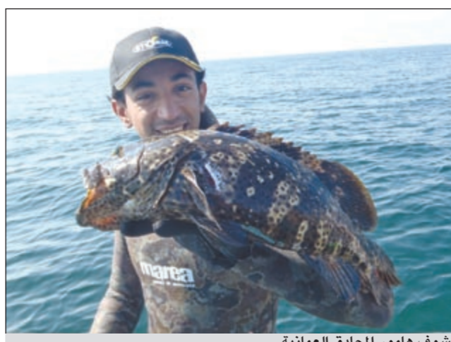
شوف هامور المحادق العمانية