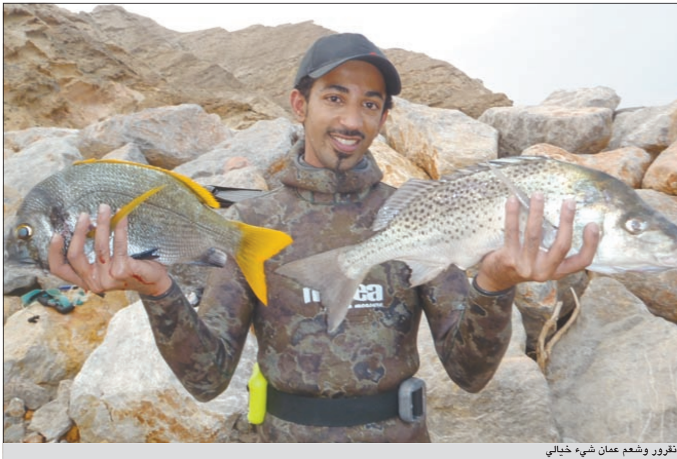
نقرو وشمع عمان شيء خيالي

دعوة تحب ان توجهها ولن؟ ● احب ان اوجه دعوتي لاخواني الغواصين المبتدئين بان يتجهوا الى وزن الرصاص وان يختاروا الوزن المناسب والى اخواني الحدائق وارجو منهم المحافظة على بحرنا الغالي وعدم رمي اللب والاكياس به وارجو منهم الاهتمام بعبء السلامة والاسعافات الاولية دون نقصان وفي الختام ادعو للجميع بالصيد الوفير والسلامة.