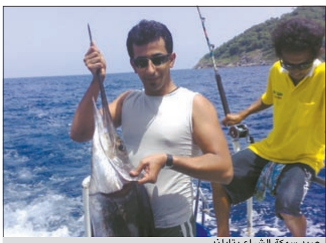
صيد سمكة الشراع بتايلند

ما افضل اماكن الغوص؟ ● الاماكن كثيرة واكثر الذين يمارسون هواية الغوص يفضلون الجنوب بشكل عام وذلك لعدة اسباب ومنها صفاء الماء وتوافر المرجان والقصاصير والارياق والجزر وانا افضل اكثر شيء الزور وام المرامد وكبير وقاروة