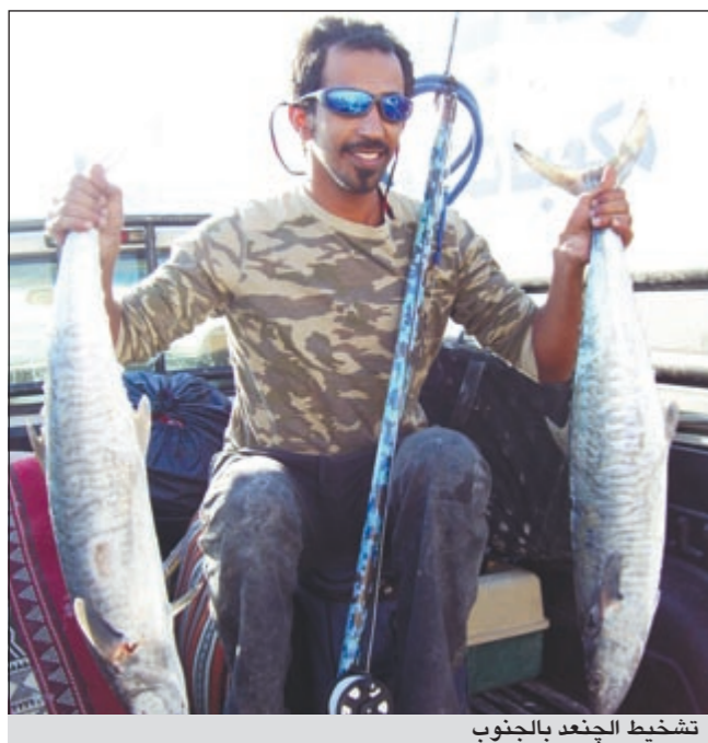
تشخيص الجندع بالجنوب