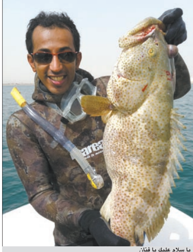
يا سلام عليك يا فنان