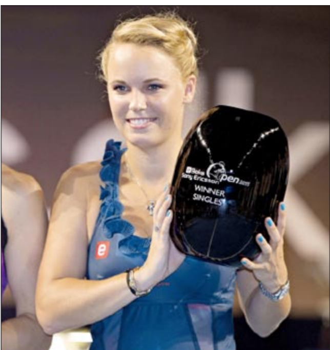
الدمنماركية كارولين فوزنياكي حاملة جائزتها