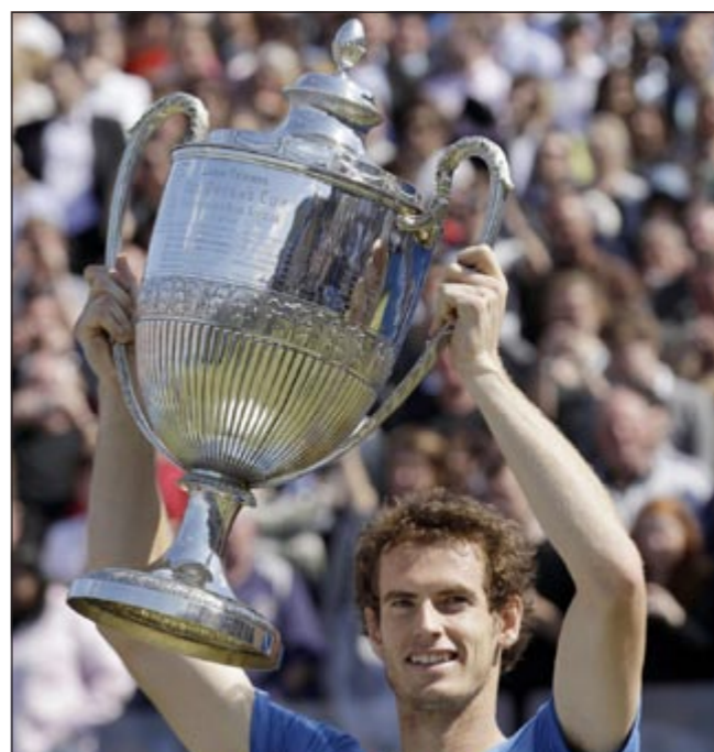
البريطاني اندي موراي رافعا كأس كوينز

وأحرز البريطاني اندي موراي المصنف ثانياً لقب بطل دورة كوينز الإنجليزية الدولية إثر فوزه على الفرنسي جو ويلفريد تسونغوا الخامس 3 - 6 و 7 - 6 (7 - 2) و6 - 4 في المباراة النهائية التي اجلنتها الامطار الغزيرة امس.