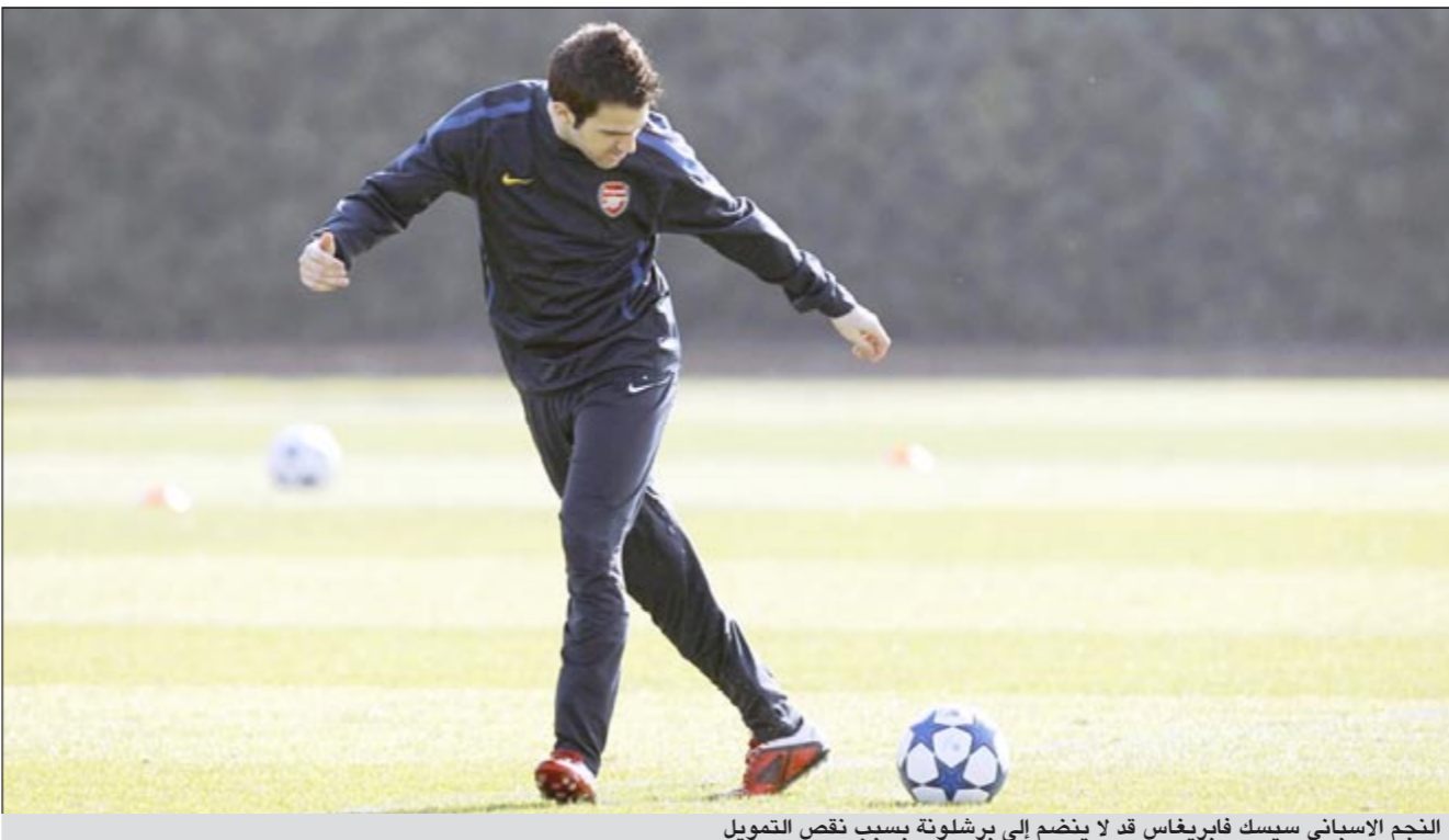
النجم الإسباني سيسك فابريغاس قد لا ينضم إلى برشلونة بسبب نقص التمويل

وقال خافيير فاوس نائب رئيس النادي للشؤون الاقتصادية في تصريح الأسبوع الماضي «لدينا 45 مليون يورو للتعاقدات. لو أنفقنا 65 أو 70 مليون، سيكون علينا البحث عن طرق للحصول على بقية الأموال»، وذلك عندما سئل عن الإنفاق المحتمل لضم سيسك روسى أو الكسيس وغيرهم. والحقيقة أن الأرقام لا تبدو متوافقة، بصرف النظر عن أن برشلونة يؤكد أن القيمة المحصنة قد تزيد عبر بيع بعض من لاعبي النادي الحاليين. فالقيمة التي تحدث عنها فاوس وبلغت 45 مليون يورو هي عمليا سعر الإسباني سيسك فابريغاس لاعب أرسنال