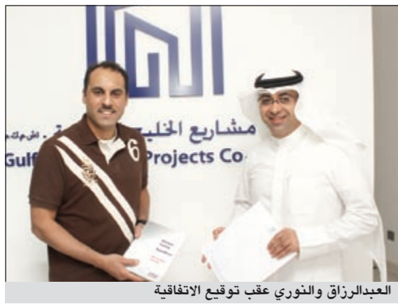
العبدالرزاق والثوري عقب توقيع الاتفاقية

أعلنت شركة مشاريع الخليج العقارية عن توقيعها اتفاقية مع شركة أوتوديزاين المختصة بالعوازل الحرارية للزجاج، حيث توفر بموجب هذه الاتفاقية خدمات جيدة لمستشاري برج الدروازة 51 وبما يوفر طابعا جديدا يميزه عن باقي الأبراج.