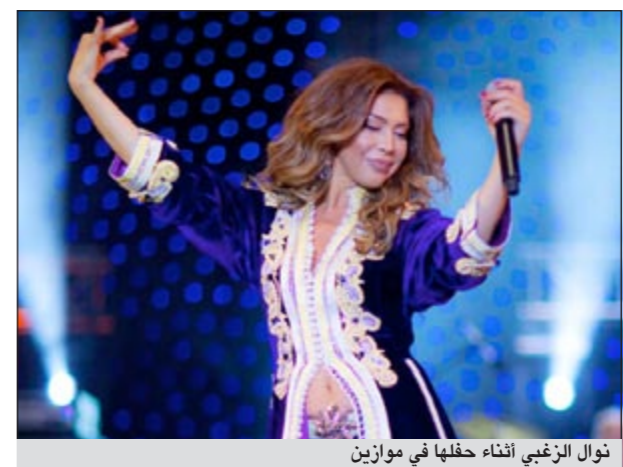
نوال الزغبى أثناء حفلها في موازين

شنت مغربيات هجوما عنيفاً على المطربة اللبنانية نوال الزغبى بعد اطلاليتها مؤخراً في مهرجان موازين بالمغرب مرندية عباءة مغربية كشفت جزءاً من بطنها، وهو ما اعتبرته اهانة لزيهن الوطني الذي يعتبر رمزاً للشمسة والوقار، ورغم مرور وقت على الحفلة التي ارتدت فيها الزغبى هذا الزي، إلا أن الغضب النسائي المغربي لا يزال يملأ المنتديات وموقع «الفيس بوك». والطريف أن هذه الآراء تتناقض مع ما عبرت عنه