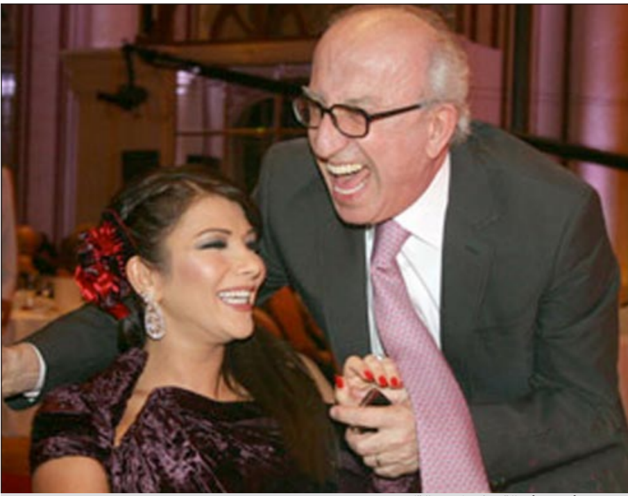
سيمون أسمر وأصالة.. ضحك من القلب

منذ أشهر، التقى المخرج اللبناني الكبير سيمون أسمر بأصالة ضمن أنشطة مهرجان «بيروت» الذي كرم الفنانة السورية التي كانت وقتها حاملاً في شهرها الأولى، ومن المعروف أن صداقة تجمع