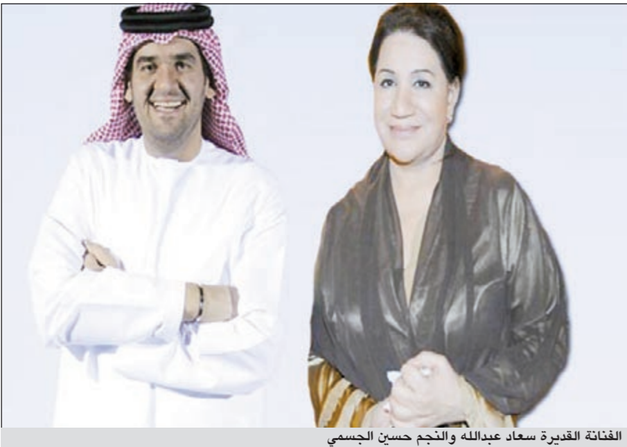
الفنانة القديرة سعاد عبدالله والنجم حسين الجسمي

وسيحسب الجمهور كلماتها وألحانها وغناها وإحساسها. ويقول مطلعها: إنسى اللي فات.. للعثرة جولة للأمل جولات.. تحي بسكات الجدير بالذكر أن مسلسل «فرصة ثانية» تأليف وداد الكواري وإخراج علي العلي وبطولة عبدالعزيز جاسم وحسين المصور وإلهام الفضالة وخالد أمين ومشاري البلاد وعبير أحمد وحسين المهدي ومرام وملاك والعديد من نجوم الفن.