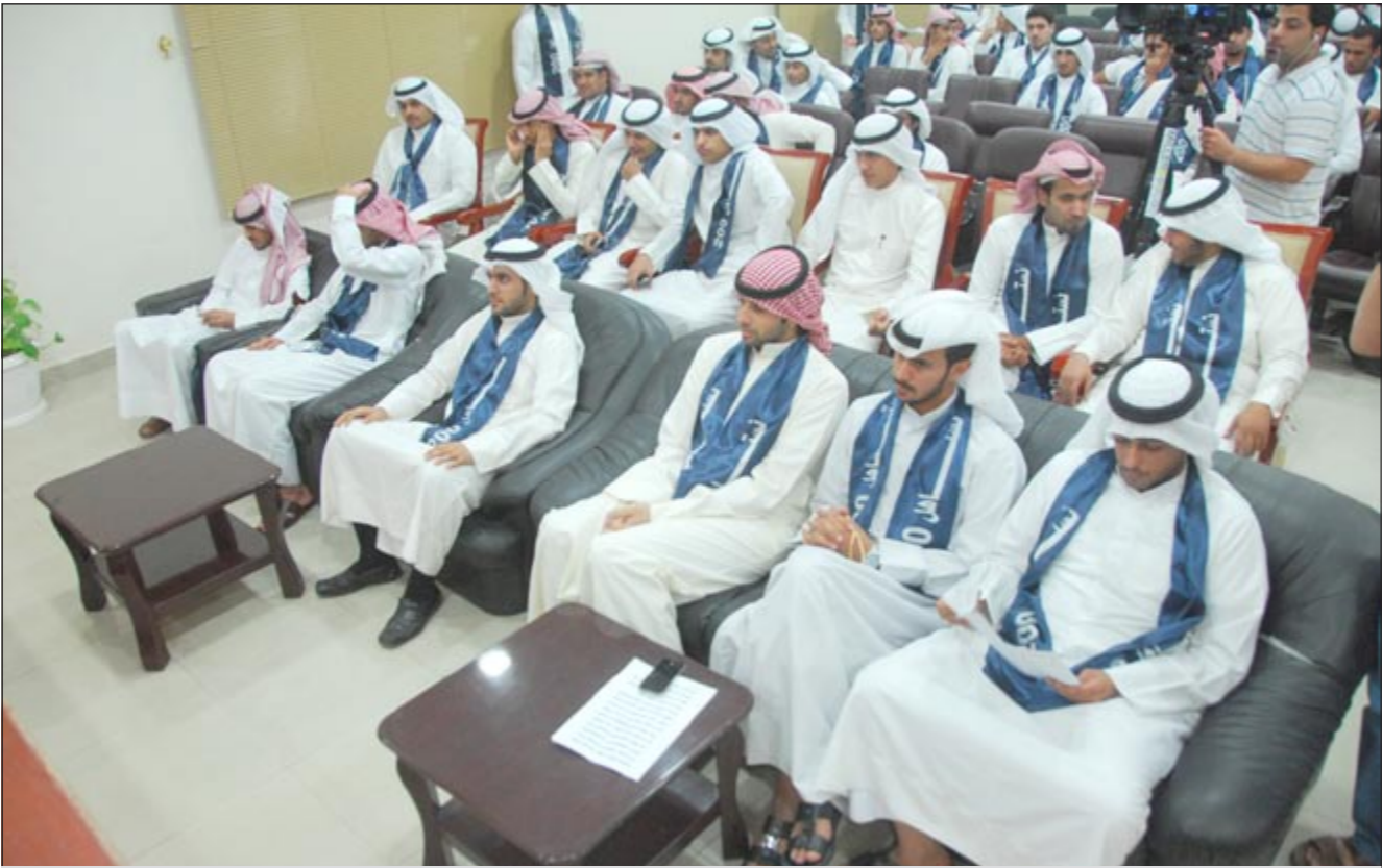
جانب من الحضور في اللقاء

أكدوا في ندوة «نستاهل الـ 200» أن أبناء الكويت بحاجة إلى الزيادة في ظل غلاء المعيشة