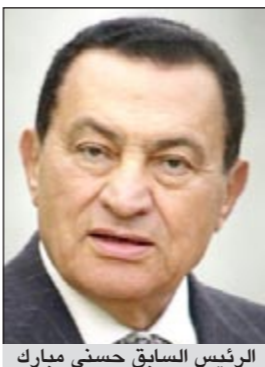
الرئيس السابق حسني مبارك

مفاجأة من العيار الثقيل كشفت عنها أوراق التحقيقات التي تسلمتها محكمة استئناف القاهرة في قضية التبرج والمشاركة في قتل المتظاهرين المتهم فيها الرئيس السابق حسني مبارك ونجلاء علاء وجمال، ورجل الأعمال حسين سالم، وهي وجود 16 شاهد إثبات ضد مبارك أبرزهم نائيب الرئيس السابق اللواء عمر سليمان. وتناقش محكمة جنابات شمال القاهرة هؤلاء الشهود خلال محاكمة مبارك التي تبدأ يوم الثلاثاء من أغسطس المقبل، ومن بينهم قيادات بوزارة البترول ومحافظون سابقون وضباط بمباحث الأموال العامة. وكشفت الأوراق بحسب صحيفة «الأهرام» عن أن عمر سليمان قد أكد في شهادته حول أسباب سقوط النظام