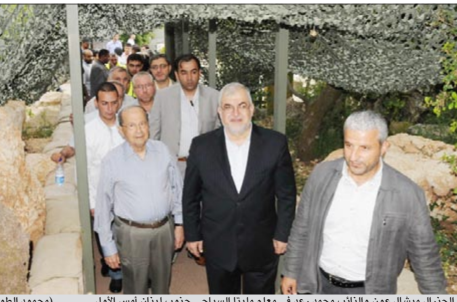
الجنرال ميشال عون والنائب محمد رعد في معلم مليتا السياحي جنوب لبنان أمس الأول (محمود الطويل)

تنهار في العالم العربي، وقال لصحيفة «الواء» في حديث ينشر اليوم الاثنتين: لقد عودنا العماد عون على تعطيل البلد عند تشكيل كل حكومة، وقال ان الحديث عن الغاء «الطائف» سيفتح باب جهنم علينا. وهكذا لا يبدو للمرأقين في بيروت ان جديدا قد يطرأ على سلبليات الموضوع الحكومي الذي سيكون مشغولا بالجلسة النيابية التشريعية الفانية لمجلس النواب التي حددها الرئيس نبيه بري يوم الأربعاء، وكذلك في البازار السياسي، المالي، الذي افتتحته الأكثرية الجديدة، من خلال لجنة المال والموازنة التي يرأسها النائب العوني ابراهيم كنعان، والذي يؤول إلى استدعاء وزراء المال السابقين منذ بداية عهد حكومات الرئيس الشهيد رفيق الحريري للمناقشة والمحاسبة. نقل المواجهة المالية إلى البرلمان وقد استعدت كتلة المستقبل للمواجهة، اعتقادا منها بأن قوى