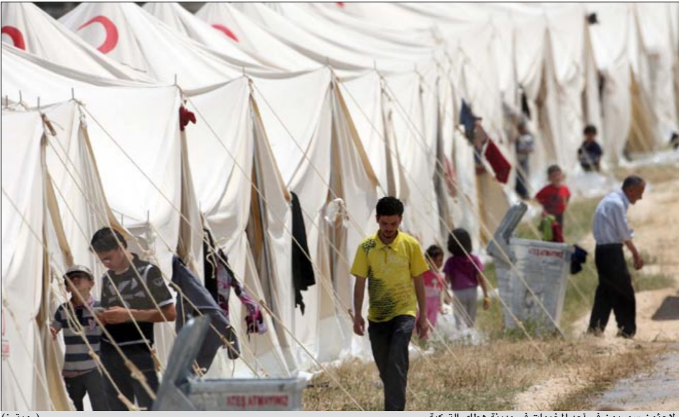
لاجئون سوريون في أحد المخيمات في مدينة حمص التركية