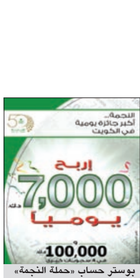
بوستر حساب «حملة النجمة»

بالإضافة إلى أربعة سحبيات كبرى تجرى خلال العام تبلغ قيمة كل جائزة منها 100,000 دينار تقام في العيد الوطني والتحرير، عيد الفطر وعيد الأضحي المبارك بالإضافة إلى ذكرى تأسيس البنك في 19 يونيو. ويمكن فتح حساب «النجمة» ابتداءً من مبلغ 500 دينار والتأهل لدخول السحب اليومي بعد فترة أسبوع وسحوبات المناسبات بعد فترة شهرين، علماً بأن حساب «النجمة» يمنح عملاءه أكبر عدد من الفرص للربح حيث يحصل العميل على فرصة للربح مقابل كل 25 دينارًا تبقى في الحساب بدلا من 50 دينارًا.