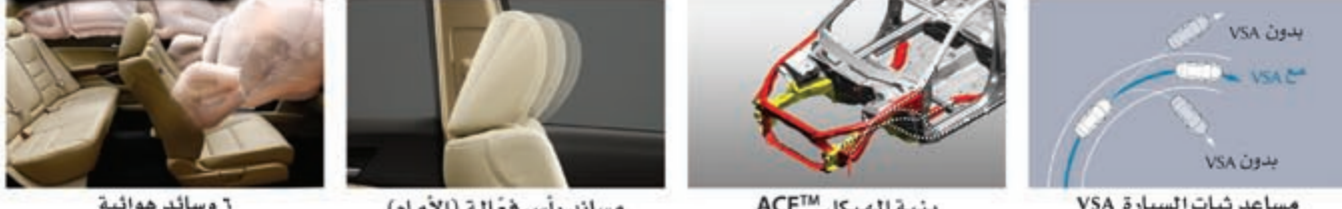
٦ وسائد هوائية مساند رأس فعالة (الأمام) بنية الهيكل ACE™ مساعد ثبات السيارة VSA