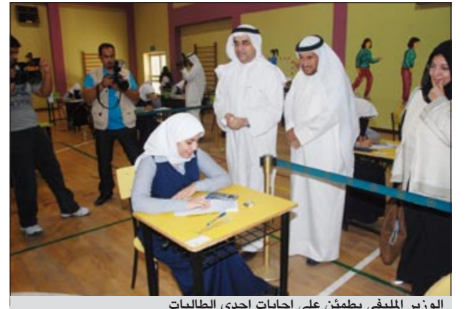
الوزير المليفي يطمئن على إجابات إحدى الطالبات

بمنقلها الى كترولي الأدبي في مدرسة صقر الشبيب بمنطقة القادسية والعمري بدراسة ابن رشد بمنطقة الفجاء، معربة عن أملها ان يتم الإعلان عن النتائج النهائية للصف الـ 12 بعد يومين من الاختبار الأخير الموافق 23 الشهر الجاري. يذكر ان طلبة القسم الأدبي في الصف الـ 12 ادوا اختبارا في مادة مبادئ التفكير الفلسفي فيما اختبر طلبة القسم العلمي بمادة الفيزياء وتنتهي اختبارات القسم الأدبي في يوم 23 الجاري والعلمي في يوم 22 منه. ● اسامة دياب وكونا