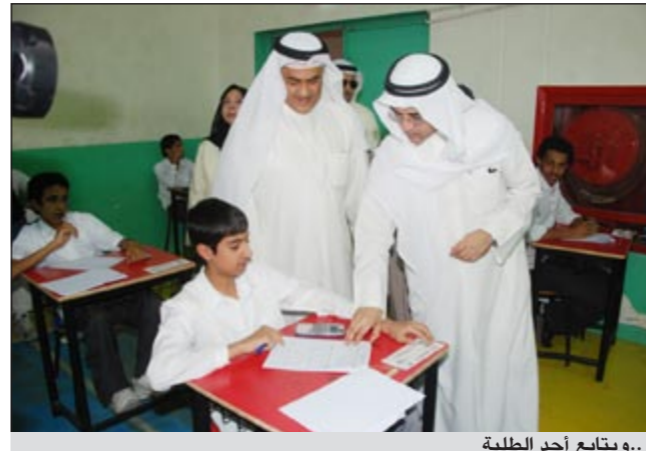
..ويتابع أحد الطلبة