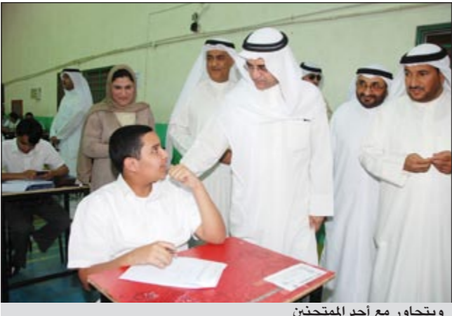
ويتحاور مع أحد المتقدمين