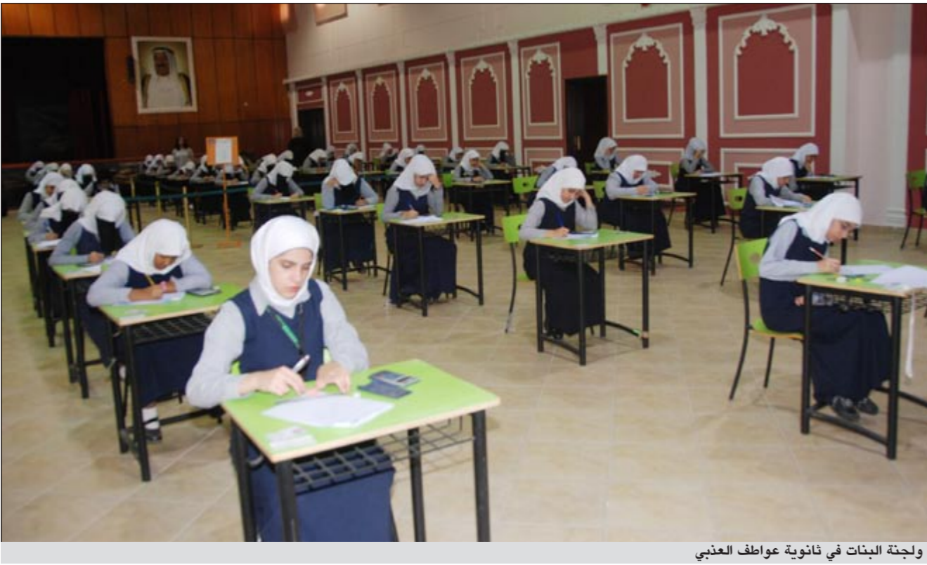
ولجنة البنات في ثانوية عواطف العذبي