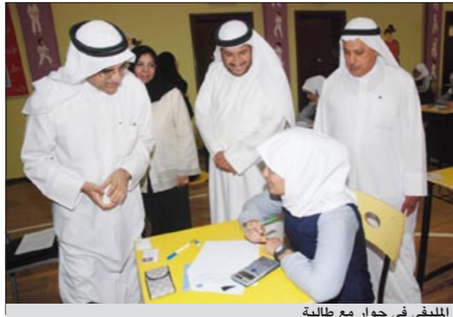
المليفي في حوار مع طالبة