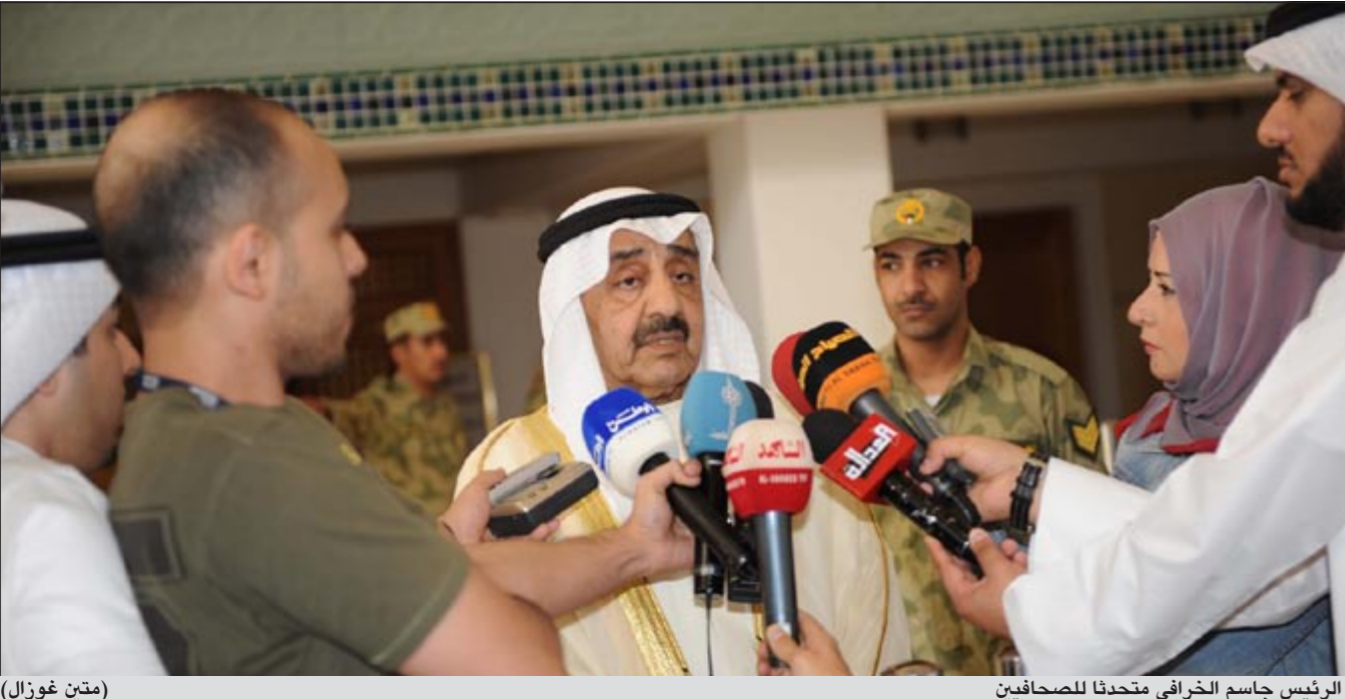
الرئيس جاسم الخرافي يتحدث للصحافيين