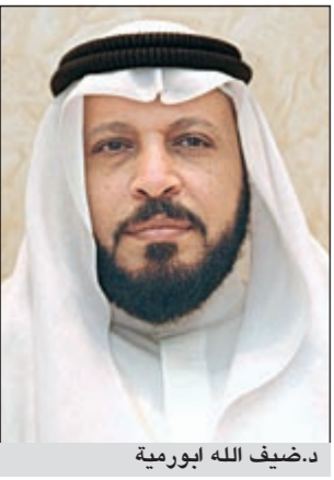
د.ضيف الله أبورية

طالب النائب د.ضيف الله أبورية الحكومة الحالية بالرحيل، إذا لم تكن قادرة على حل مشاكل التلوث والأغذية الفاسدة، لاسيما تلوث مياه الشرب، معتبرا حكومة مغبية لا تملك حتى قرارها. وقال أبورية في تصريح أمس ردا على سؤاله حول رأيه في رسالة لجنة شؤون البيئة والطاقة النووية البرلمانية، حول التحقيق فيما أثر بتلوث المياه «هذا جهد نباهي تشكر عليه اللجنة، إلا أن المشكلة ليست في دراسة الموضوع داخل اللجنة، وإنما في الحكومة، التي أشك في اتجاهها إلى حل المشكلة، لاسيما أنها هي التي تسببت في إطعام الناس طعاما فاسدا، وتلوث البيئة، ولم تتحرك من أجل حل مشكلة المياه، رغم اعتراف البلدية بتلوثها». وشدد أبورية على أن حكومة مثل هذه لا تستحق البقاء، مستغبرا أنها لم تتقدم بمشروع قانون بتغليظ العقوبات على تجار الأغذية الفاسدة، مبديا استعداد المجلس للتعاون مع الحكومة في إقرار التشريعات اللازمة.